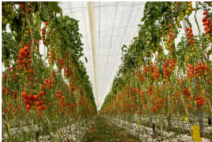
Modne tomater hang klare til innhøsting og eksport til Nord-Europa da vi var på besøk i november.

Én uke i forkant av reisen tok vi også kontakt med Coop og Bama for å høre om de kunne organisere besøk til sine produsenter. Bama sa de ikke rakk å gjøre dette på så kort frist, men vi fikk på egenhånd organisert besøk til flere av leverandørenes drivhus ved å bruke leverandørlisten overlevert som svar på første informasjonskrav. Coop hadde mellom vår første henvendelse i mars og vår reise i november sluttet å kjøpe tomater fra Almería, og hadde på det daværende tidspunktet ingen slike leverandører i provinsen. Coop forsøkte å organisere et besøk til sin nærmeste leverandør i Alicante, men sendte oss feil møtetidspunkt så dette besøket bortfalt.