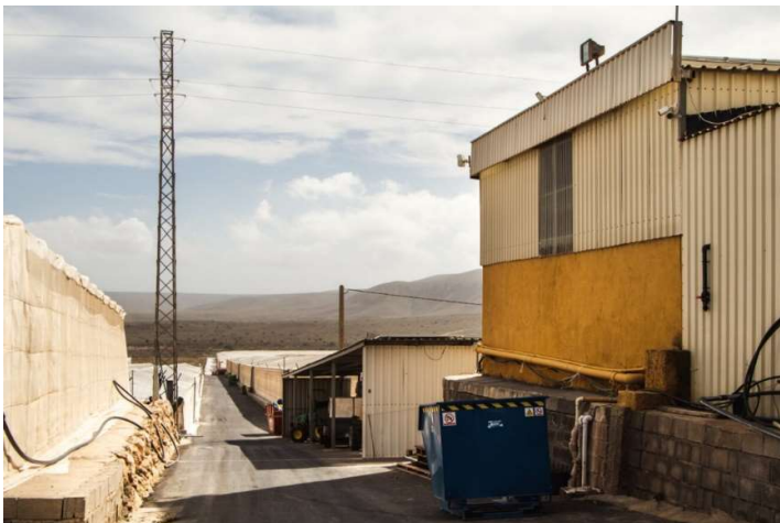
Drivhuslandskap med nasjonalpark i bakgrunnen.

I tillegg til de metodiske svakhetene ved GRASP-revisjon er det også grunn til at norske selskaper