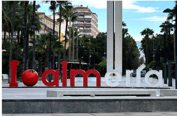
Offentlig kunstverk i sentrum av Almería by med en stilisert tomat i stedet for et hjerte.

I drivhusene produseres det året rundt. Men den mest intensive perioden er på vinteren, når det er mindre konkurranse fra europeiske lands egenproduksjon. Europeiske forbrukere foretrekker å spise grønnsaker fra sitt eget land når det er i sesong, men importerer utenfor sesong for å ha tilgang til ferske produkter. 33