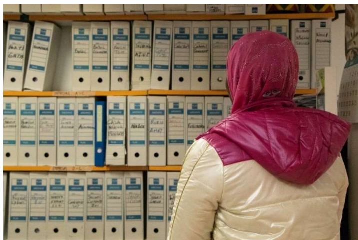
En av de Nordafrikanske drivhusarbeiderne vi intervjuet.

Flere drivhusarbeidere forteller at de ofte blir utskjelt av sjefene sine. De sier de har blitt kalt «udugelige», «esler», og at de generelt snakkes til uten respekt. Dette ble beskrevet av en av interesseorganisasjonene for migranter vi intervjuet som spesielt tungt for migrantarbeidere, fordi disse ikke har et stort sosialt nettverk i Spania. De er stort sett enten på jobb