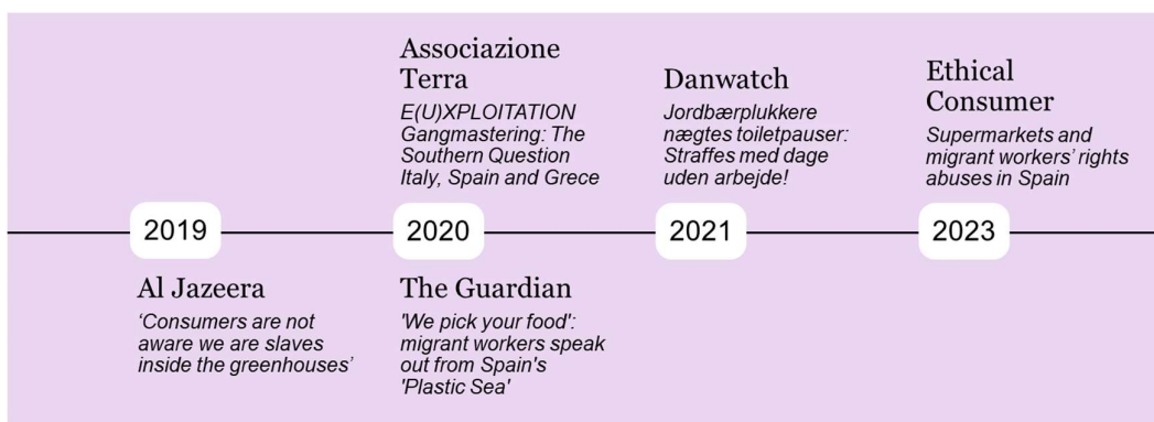
Figur 2: Tidslinje over noen tidligere rapporter om rettighetsbrudd i det sør-spanske jordbruket.

Utfordringer med arbeidsforholdene i jordbruket i Sør-Spania har vært diskutert i mange omganger: