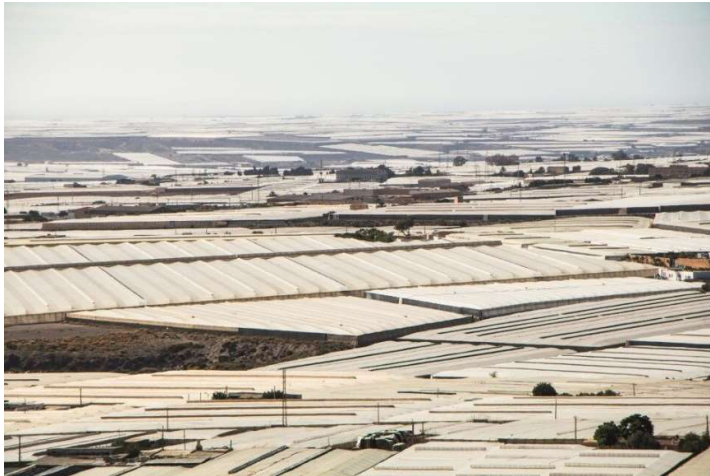
Området El Ejido i Almería, kalt "Plasthavet".

Langs middelhavskysten i Almería foregår storstilt eksportproduksjon av frukt og grønt under et tak av over 400 kvadratkilometer plastdrivhus, også kalt «Plasthavet». 28 Her finnes gode arbeidsforhold med fagorganiserte arbeidere og ressurseffektiv produksjon ved siden av gårder med lovbrudd der utnyttede og underbetalte migrantarbeidere jobber i farlig høye temperaturer med manglende beskyttelsesutstyr mot sprøytemidlene som brukes. Situasjonen kritiseres blant annet av Olivier De Schutter, FNs spesialrapportør på menneskerettigheter. 29