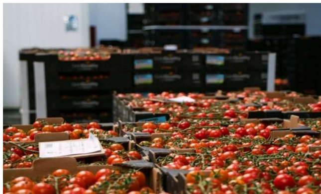
Klasetomater på et pakkeri i Almería, klare for eksport.

Mange av migrantarbeiderne vi snakket med har jobbet i slike drivhus tidligere, før de fikk arbeidstillatelse og kunne begynne å jobbe for gårder som driver med eksportproduksjon. De beskriver det som en forbedring å jobbe på gårdene der de jobber nå. Men i all den tid det fortsatt foregår rettighetsbrudd også på eksportrettede gårder krever dette forbedring og gjenoppbygging.