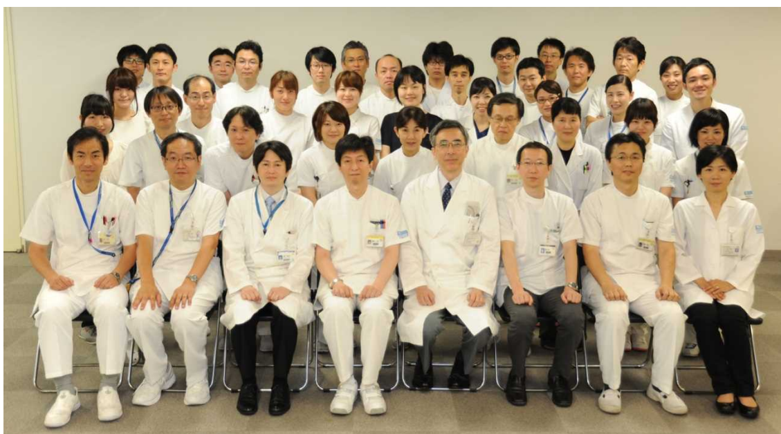
東京大学医学部附属病院リハビリテーション科・部のスタッフ

設備： 専攻医室ーなし 専攻医机ー有 カンファレンスルーム・図書室ー有 医学部図書館あり主要雑誌の論文ダウンロード可能