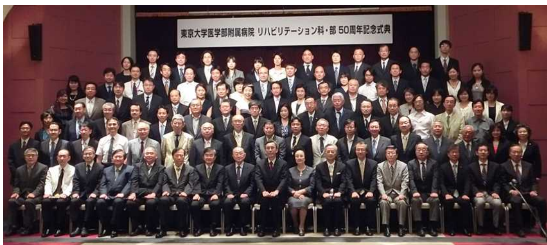
50周年記念式典（2013年7月20日）

連携施設・関連施設として、東京都及び隣接する県に、回復期病棟をもつリハビリテーション専門病院や総合病院、脊髄損傷・切断・摂食嚥下・小児など専門性の高い研修を行うことができる専門病院や総合病院、障害児・者施設を幅広く揃えています。このため研修プログラムの3年間で、大学病院における急性期リハビリテーション、回復期リハビリテーション、専門性のあるリハビリテーション、の3本柱から成る研修を可能とし、また関連施設などを利用して、生活期のリハビリテーション、障害者福祉などを経験することができます。