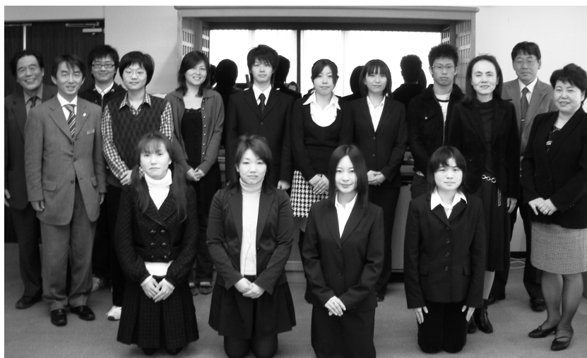
入賞者と審査委員の皆さん

なお、入賞者及び応募者全員に記念品が贈呈されております。次回も多数の応募をお待ちしております。