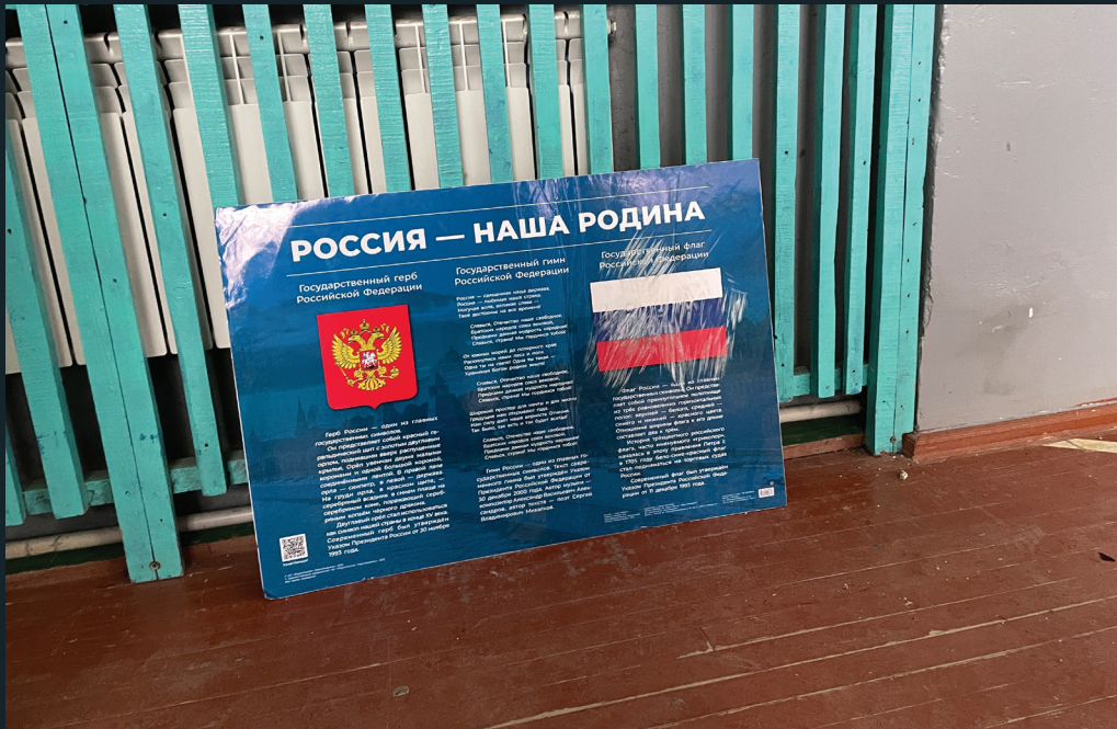
(обкладинка) Російські підручники, завезені окупаційною владою до школи у селищі Борова на Харківщині. Фото зроблене у листопаді 2022 року.