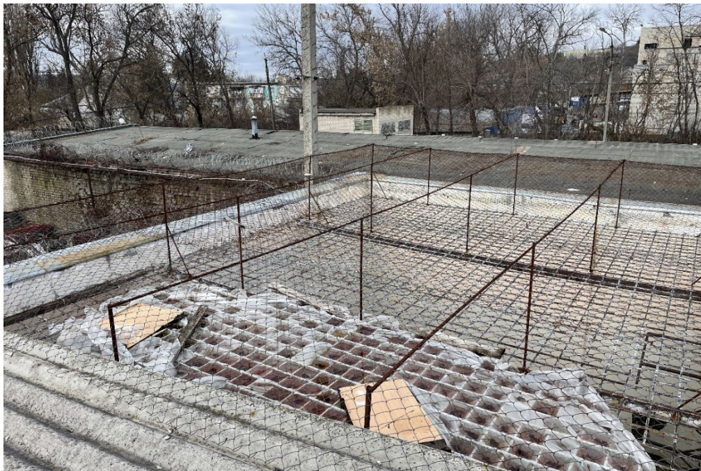
У цій камері просто неба у відділку поліції міста Куп'янськ на Харківщині російська окупаційна влада утримувала українців, серед яких були й працівники освіти. Фото зроблене 7 листопада 2022 року.