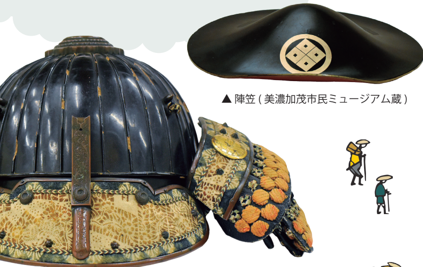
▲陣笠(美濃加茂市民ミュージアム蔵)

紹介した資料をはじめ、中山道や本庄宿、太田宿に関わる資料約60点を展示します ※会期中一部展示替えあり