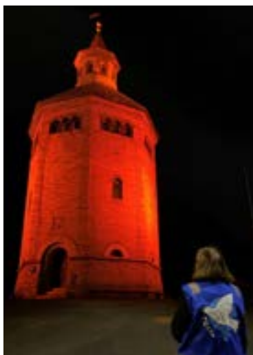
Valbergtårnet med oransje lyssetting.

25. november er FN sin internasjonale dag til bekjempelse av vold mot kvinner. IKFFs Stavangeravdeling har i mange år samarbeidet bredt om markering av dagen. Det var en større markering i Stavanger sentrum. Mange partier og grupper deltok: Stavanger Soroptimister, Kvinnegruppa Ottar, Stavanger Høyre, Stavanger Venstre, Rogaland Venstrekvinnelag,