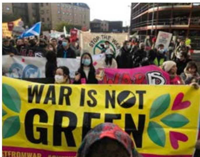
Bilde fra COP26, tatt fra Stop the War Coalition.

IKFF fikk også inn et debattinnlegg i Klassekampen i forbindelse med COP26: Hva med klimaverstingen? https://www.ikff.no/ikff-i-mediene .