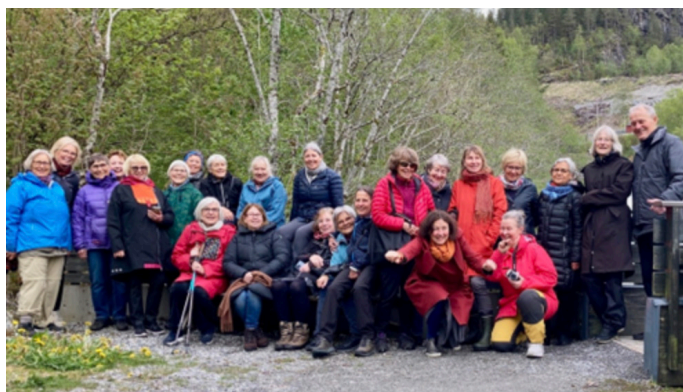
Deltakerne på tur i Fredsløypa.