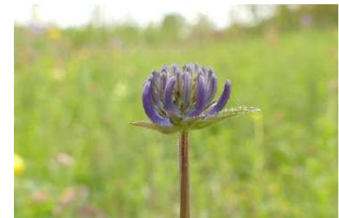
Teufelskrallen-Arten* ( Phyteuma spec. )