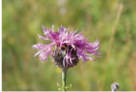
Flockenblumen-Arten* ( Centaurea spec. )