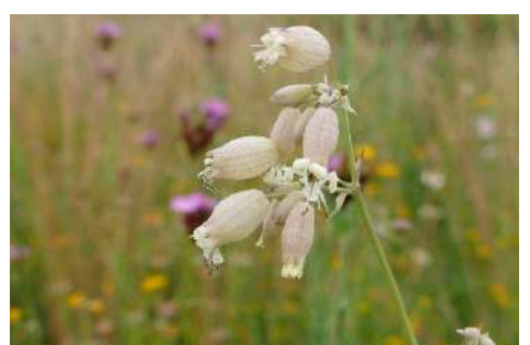
Lichtnelken, Leimkraut (ohne Weiße Lichtnelke)* ( Silene spec. )