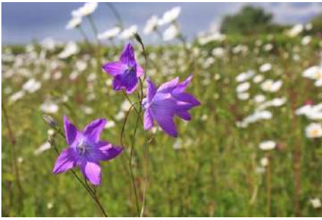
Glockenblumen-Arten* ( Campanula spec. )