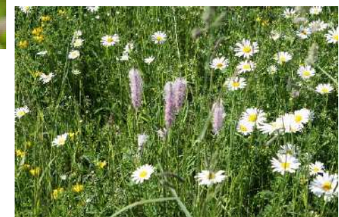
Mittlerer Wegerich ( Plantago media )