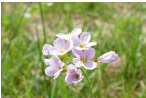
Wiesen-Schaumkraut ( Cardamine pratensis )