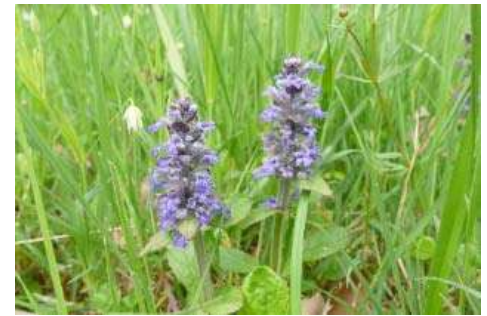
Günsel-Arten* ( Ajuga spec. )