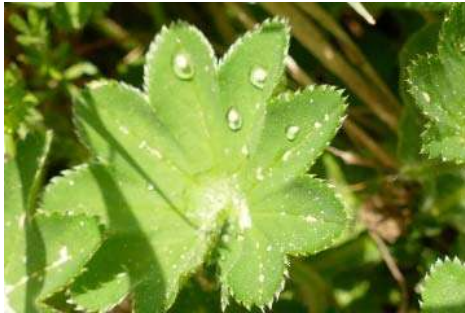
Frauenmantel-Arten* ( Alchemilla vulgaris agg.)