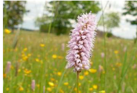
Wiesen-Knöterich ( Bistorta officinalis )