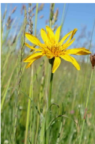
Wiesen-Bocksbart ( Tragopogon pratensis agg. )