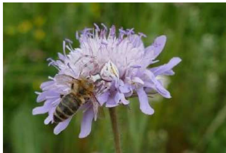
Witwenblume , Skabiosen- Arten, Teufelsabbiss* ( Knautia arvensis , Scabiosa spec. , Succisa pratensis )