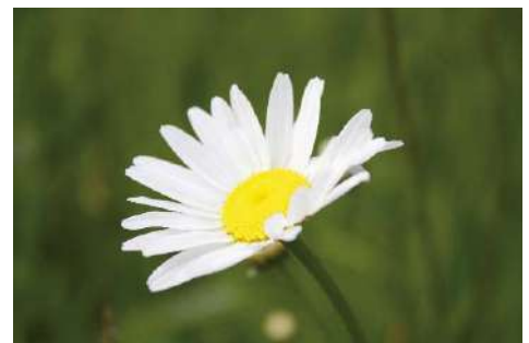
Wiesen-Margerite ( Leucanthemum vulgare agg. )