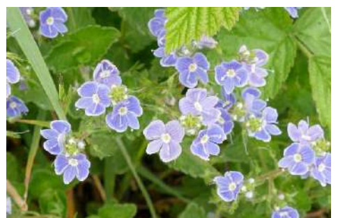
Artengruppe Gamander-Ehrenpreis , Echter-, Quendel-, Großer Ehrenpreis, Blauweiderich-Arten* ( Veronica* )