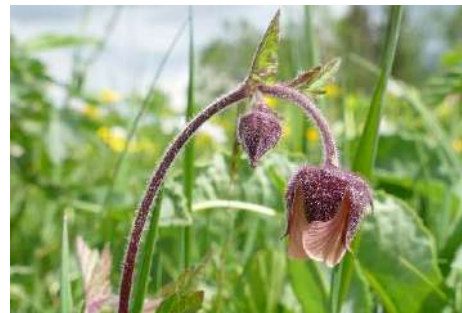
Bach-Nelkenwurz ( Geum rivale )