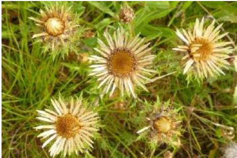
Silber-, Golddistel, Kleine Eberwurz * ( Carlina spec. )