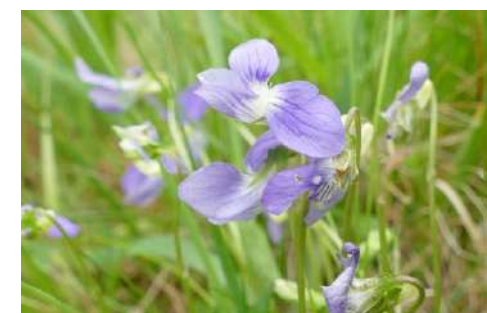
hochwüchsige Veilchen-Arten* ( Viola stagnina , V. elatior , V. pumila , V. canina , V. riviniana )