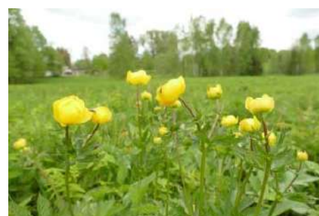
Trollblume ( Trollius europaeus )