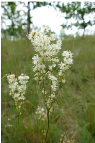
Mädesüß-Arten* ( Filipendula ulmaria (nass); F. vulgaris (trocken))