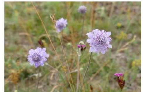
Witwenblume, Skabiosen-Arten , Teufelsabbiss* ( Knautia arvensis , Scabiosa spec. , Succisa pratensis )