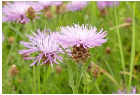
Flockenblumen-Arten* ( Centaurea spec. )