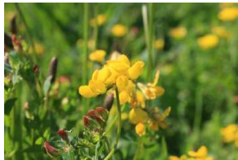
Hornklee-Arten* ( Lotus spec. )