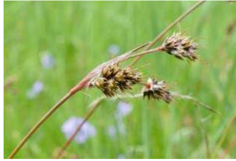
Hainsimsen-Arten* ( Luzula spec. )