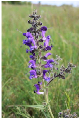
Wiesen-Salbei ( Salvia pratensis )