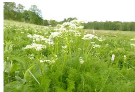
Bärwurz ( Meum athamanticum )