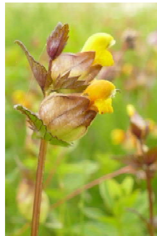
Klappertopf-Arten* ( Rhinanthus spec. )