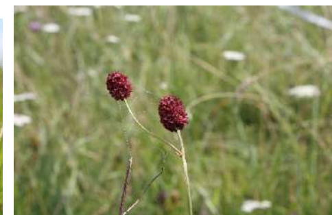
Wiesenknopf-Arten, Kleine Bibernelle* ( Sanguisorba officinalis , S. minor , Pimpinella saxifraga )