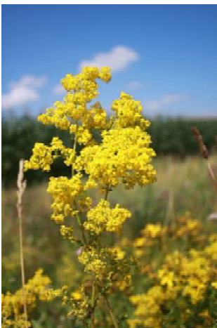
Echtes Labkraut ( Galium verum )