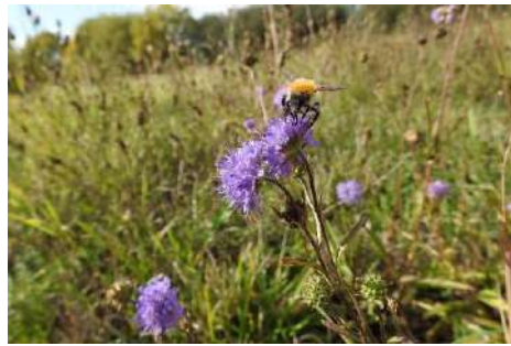
Witwenblume, Skabiosen-Arten, Teufelsabbiss* ( Knautia arvensis , Scabiosa spec. , Succisa pratensis )