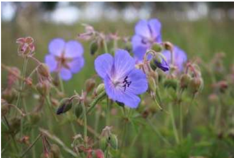
großblütige Storchschnabel-Arten* ( Geranium pratense , G. palustre , G. sylvaticum )