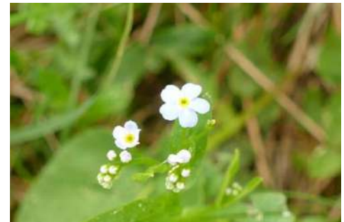
Vergissmeinnicht-Arten* ( Myosotis spec. )