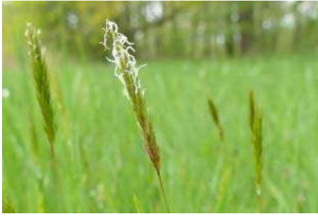
Gewöhnliches Ruchgras ( Anthoxanthum odoratum )