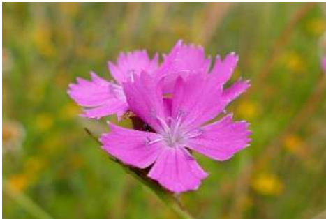
Nelken-Arten* ( Dianthus spec. )