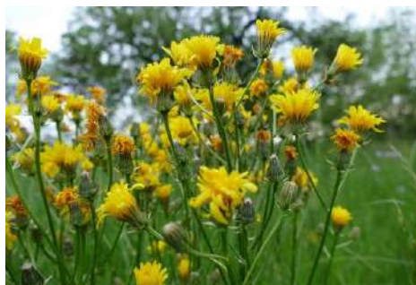
Pippau-Arten* ( Crepis spec. )