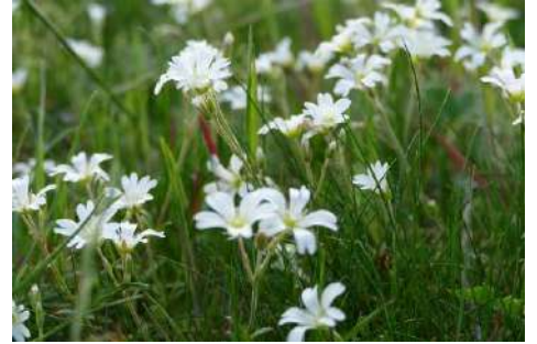
Acker-Hornkraut ( Cerastium arvense )