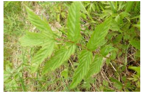
Mädesüß-Arten* ( Filipendula ulmaria ; F. vulgaris )