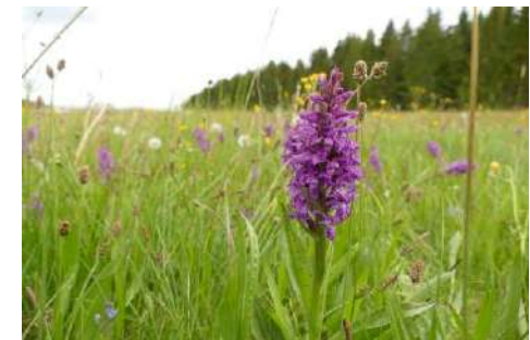
Orchideen-Arten* ( Orchidaceae )