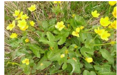
Sumpf-Dotterblume ( Caltha palustris )