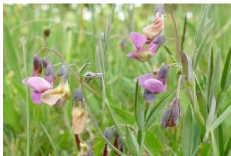
Platterbsen-Arten* ( Lathyrus pratensis , L. linifolius , L. palustris )