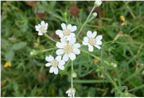
Sumpf-Schafgarbe ( Achillea ptarmica )