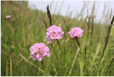
Grasnelke ( Armeria maritima agg.)