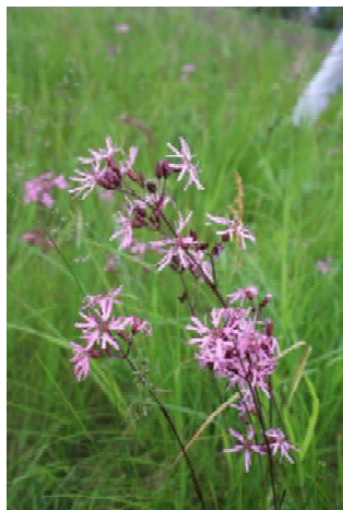
Kuckucks-Lichtnelke ( Lychnis flos-cuculi )