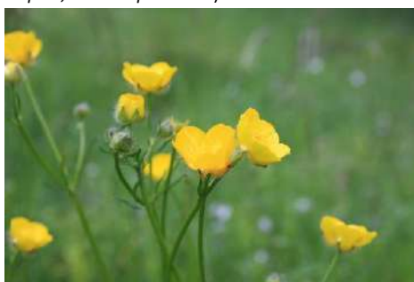
Hahnenfuß-Arten* ohne Kriechenden und Giftahnenfuß ( Ranunculus spec. )