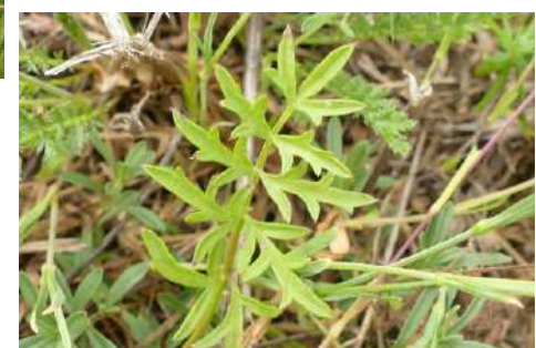
Wiesen-Silau, Kümmel-Silge, Brenndolde* ( Silaum silaus , Selinum carvifolia , Selinum dubium )