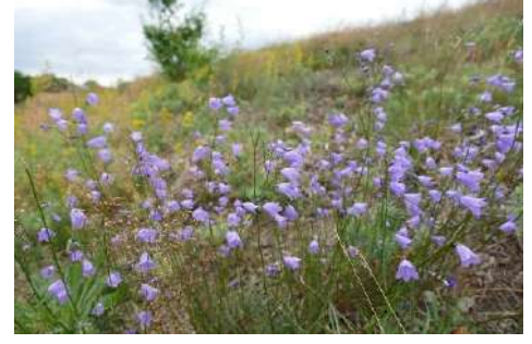
Glockenblumen-Arten* ( Campanula spec.. )