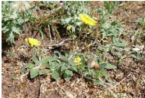
Habichtskraut ( Hieracium pilosella )