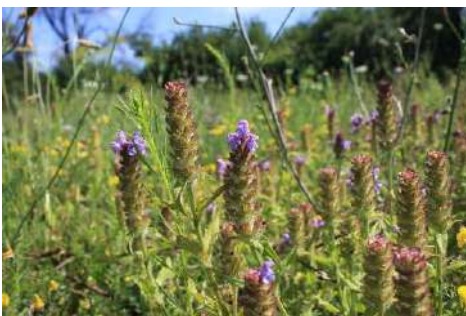
Braunelle-Arten* ( Prunella spec. )