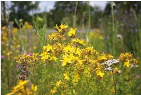
Johanniskraut-Arten* ( Hypericum spec. )