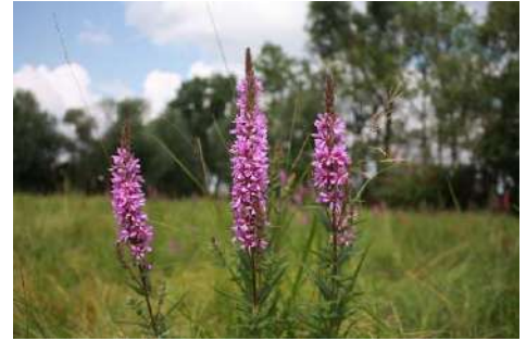
Blut-Weiderich ( Lythrum salicaria )