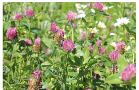
Rotklee, Zickzack-Klee* ( Trifolium pratense , T. medium )