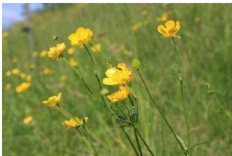
Hahnenfuß-Arten* ohne Kriechenden und Gifthahnenfuß ( Ranunculus spec. )