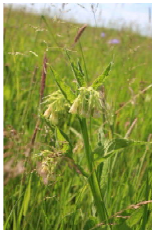
Beinwell ( Symphytum officinale )