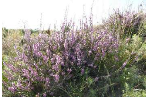
Besenheide ( Calluna vulgaris. )