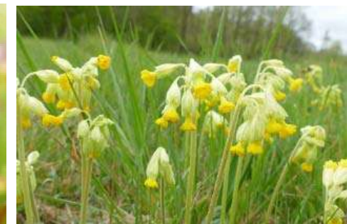
Schlüsselblumen-Arten* ( Primula spec. )