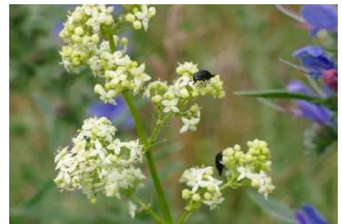
Labkraut-Arten* ohne Klettenlabkraut ( Galium spec. )