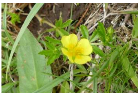
Fingerkraut-Arten* ohne Gänsefingerkraut und Kriechendes Fingerkraut ( Potentilla spec. )