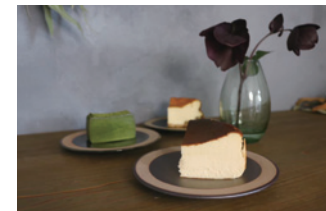
POSレジのデータを活用した、季節ごとに変化を見せるメニュー。

POSレジは1日の合計売上金額を自動で計算してくれるため、レジ締め時間が大幅に削減されました。さらに、販売した商品や金額、来店日時なども記録されるため、売上の分析を行うことができます。売れ行きの良いメニューに基づいた新メニューの開発に取り組んでいるほか、データから日々の売上を予測することで、材料の過剰在庫や食材ロスも防ぐことができました。