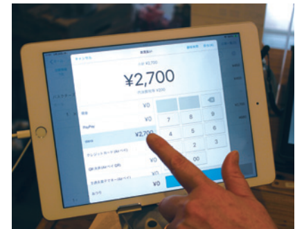
お店のメニュー構成に合わせて、使いやすいようにボタン配置などをカスタマイズ可能。