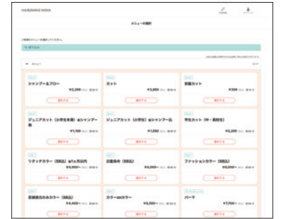
自社ホームページの予約システム

新規のお客さまはもちろん、既存のお客さまも半数近くが予約システムを利用しています。予約システムは電話予約と異なり、 お客さまが24時間好きなときに予約できます 。営業時間を気にしたり、スタッフが施術中で電話をとるまでに時間がかかってしまったりという心配もないため、お客さまからは「便利になった」とたいへん好評です。また、システムから予約確認メールやリマインドメッセージを自動的に送ることができます。そのおかげで、事前に連絡がないキャンセルはほとんどありません。インターネット予約に不慣れなお客さまにも、「ちゃんと予約できている」と安心してもらえています。