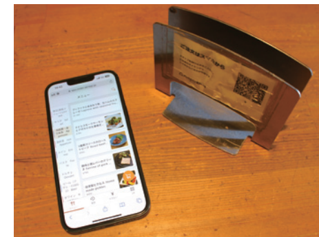
いつでも注文できるから、お客さまの注文待ちストレスはゼロに。年齢を問わずほとんどのお客さまが自分の端末から注文している。

モバイルオーダーを導入することは、「ホールスタッフを常に1人確保できている」状態と同じです。オーダー業務にかかる手間、時間が減ったことで、人件費の削減につながっています。さらに、スタッフには空いた時間を活用して、新メニューの開発を手伝ってもらっており、若手スタッフの柔軟な発想を形にしたメニューはとても好評です。裁量のある仕事を任せることで、スタッフの定着にもつながっています。