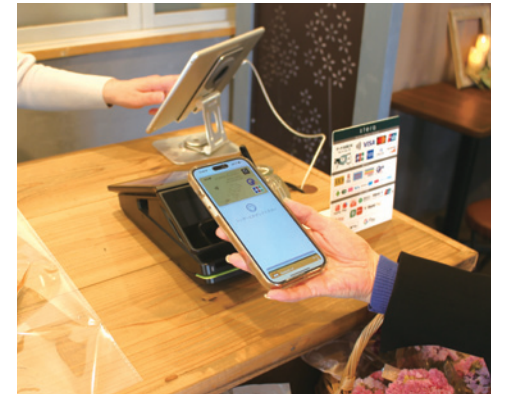
1台の端末でさまざまな支払方法に対応。

当店では、キャッシュレス決済システムを導入し、クレジットカード・バーコード決済・電子マネーなど、幅広い支払方法に対応しています。最近は現金を持ち歩かない方も多く、キャッシュレス決済の利用割合は徐々に増えています。現金の受渡しが減ったことで、会計の待ち時間はかなり短縮されました。また、併せて導入したPOSレジは、レジ打ちの際にタッチパネルで直感的に商品を選ぶことができ、軽減税率や個別会計などの計算も自動で行われることから、レジの打ち間違いやお釣りの計算ミスも起こりません。気持ちに余裕ができ、お会計時のコミュニケーションといった、お客さまとの接点も増えました。