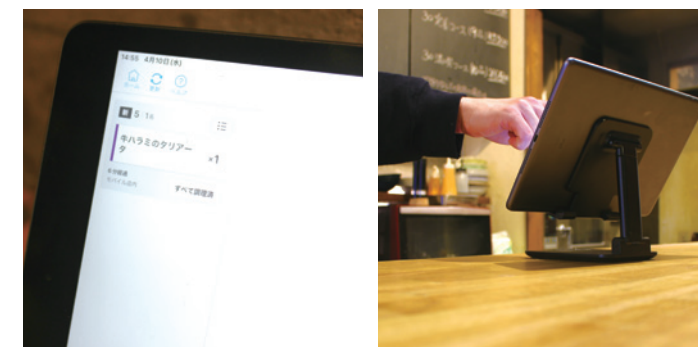
注文が入ると文字と音でお知らせ。オーダーミスやオーダー漏れも防止できる。

モバイルオーダーではスタッフの繁忙にかかわらず、お客さまが自分の好きなタイミングで注文ができます。機会損失がなくなったことに加え、スタッフに余裕ができた分、おすすめメニューを提案できるようになり、客単価は千円程アップしました。また、注文が入ると、厨房の画面に即座に注文内容が反映されることから、オーダーミスも起こりません。