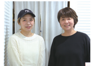
居心地の良い空間であり続ける、NOVAの取組みは続きます。

電話での予約受付が減り、施術を中断することも少なくなったので、 一人ひとりのお客さまとじっくり向き合う時間を確保できるようになりました 。予約システムと併せて顧客管理システムを導入したので、お客さまが予約時に入力した名前や連絡先などのデータを自動で保存でき、カルテの作成や顧客情報の更新作業を省力化できています。