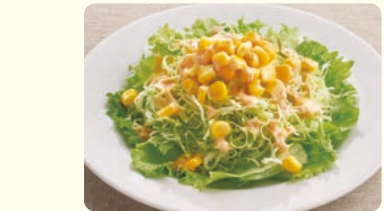
217 gói miền Nam ¥99 (税込 ¥108)

*Trọng lượng hiển thị cho khoai tây chiên cỡ lớn và khoai tây chiên là trọng lượng trước khi nấu.