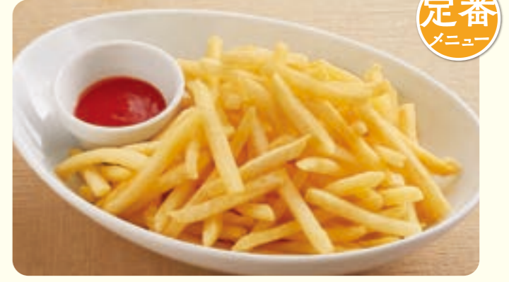
136 Khoai tây chiên cỡ lớn (360g) ¥299 (税込 ¥328)