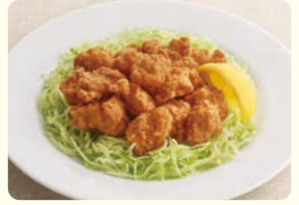
177 gà rán ¥399 (税込 ¥438)