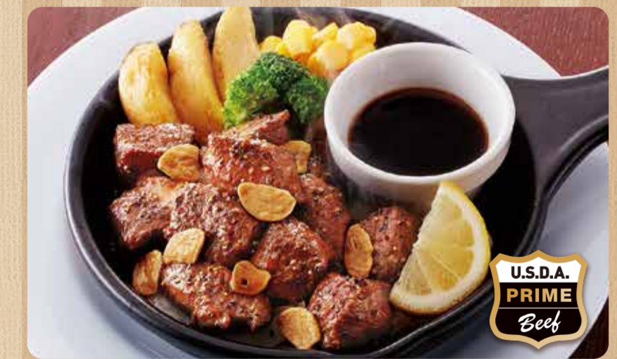
045 bít tết thái hạt lựu ¥1,039 (税込 ¥1,142)