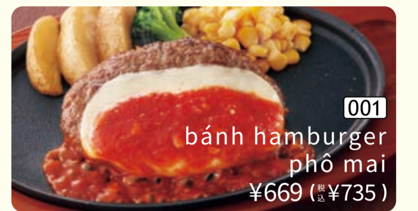
001 bánh hamburger phô mai ¥669 (税込 ¥735)