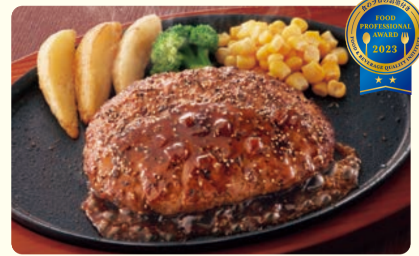
036 hamburger tiêu ¥639 (税込 ¥702)

050 NEW Bánh mì kẹp kem cua và hamburger ¥869 (税込 ¥955)