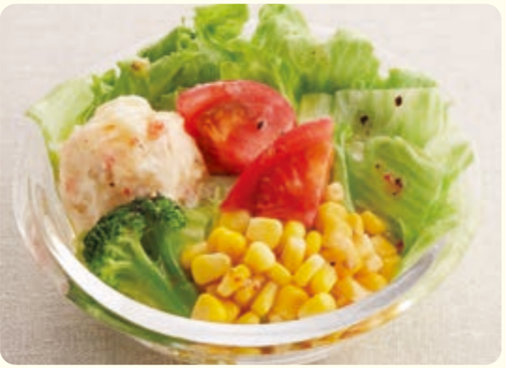
251 salad đầy màu sắc ¥199 (税込 ¥218)