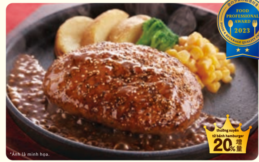
047 hamburger tiêu lớn ¥769 (税込 ¥845)