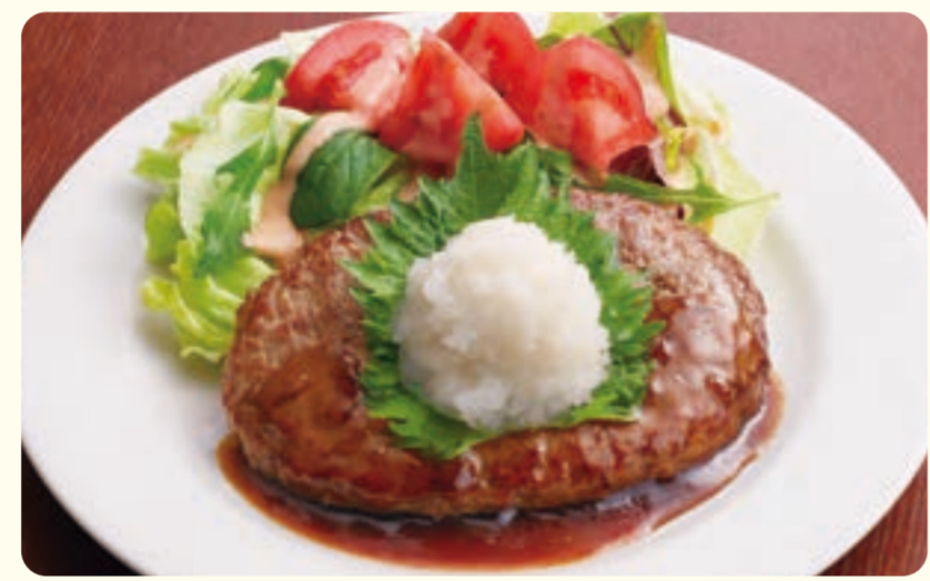
NEW 049 Hamburger kiểu Nhật ¥739 (税込 ¥812)