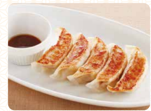
187 Gyoza đặc sản (5miếng) ¥369 (税込 ¥405)