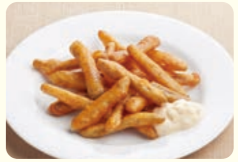
178 Củ ngưu bàng chiên ¥269 (税込 ¥295)