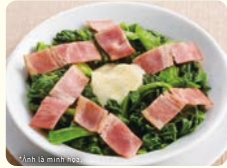
179 bơ rau chân vịt ¥269 (税込 ¥295)