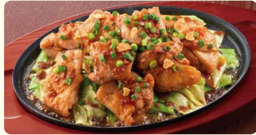
012 Thịt gà bít tết cỡ lớn với tỏi và nước tương ¥869 (税込 ¥955)

RIME là gì Loại này được Bộ Nông nghiệp Hoa Kỳ công nhận là "thứ hạng cao nhất" trong phân loại thịt bò.