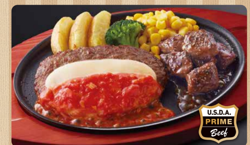
044 Hamburger phô mai & bít tết xúc xắc hảo hạng ¥999 (税込 ¥1,098)