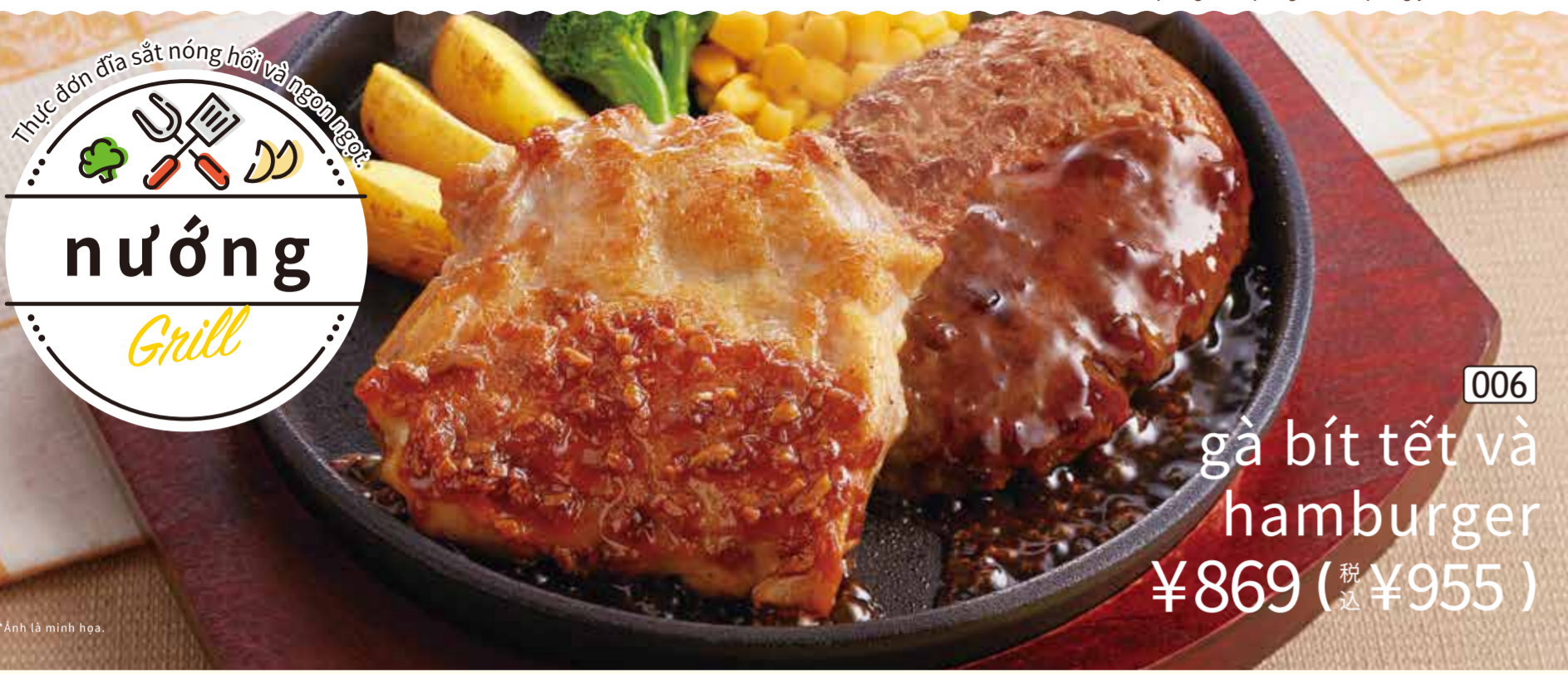
006 gà bít tết và hamburger ¥869 (税込 ¥955)