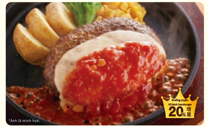
046 Bánh hamburger phô mai lớn ¥799 (税込 ¥878)