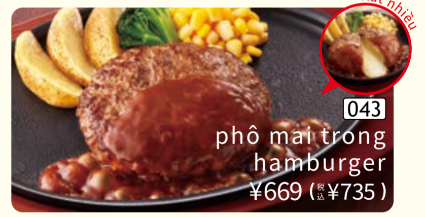
043 phô mai trong hamburger ¥669 (税込 ¥735)