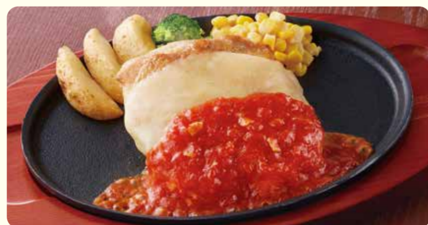
040 Bít tết gà Ý với nhiều phô mai ¥639 (税込 ¥702)