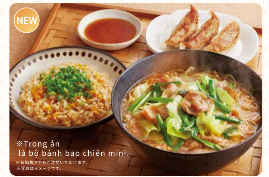
169 Tặng kèm cơm chiên mini và set gyoza ¥1,169 (税込 ¥1,285)

※ Trong ảnh là bộ bánh bao chiên mini. ※ 青筋抜きでもご注文いただけます。 ※ 写真はイメージです。