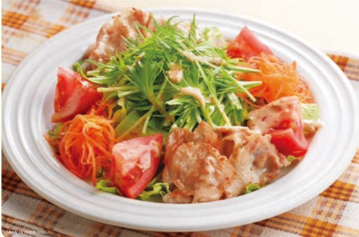
271 Salad mè với mizuna và thịt lợn nướng shabu ¥469 (税込 ¥515)