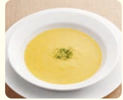
628 súp ngô ¥339 (税込 ¥372)