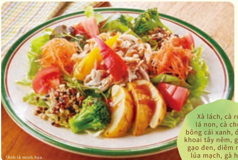
270 Salad cân bằng với 12 món sẽ khiến cơ thể bạn sáng khoái ¥599 (税込 ¥658)

Hãy thoải mái thưởng thức rau quả tươi với nước sốt đặc biệt của chúng tôi. Đây là món ăn rất tốt cho sức khỏe của bạn.