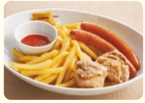
171 Gà rán & xúc xích ¥469 (税込 ¥515)