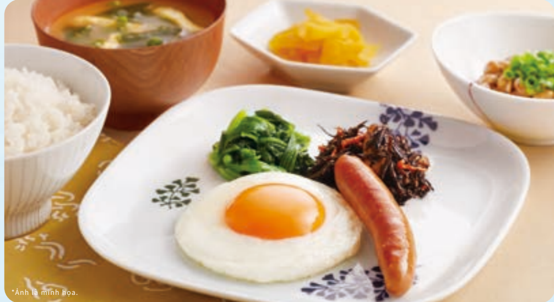
459 bữa sáng trứng chiên ¥439(税込¥482)

Hãy tận hưởng hương vị thơm ngon sẽ đánh thức cơ thể bạn.