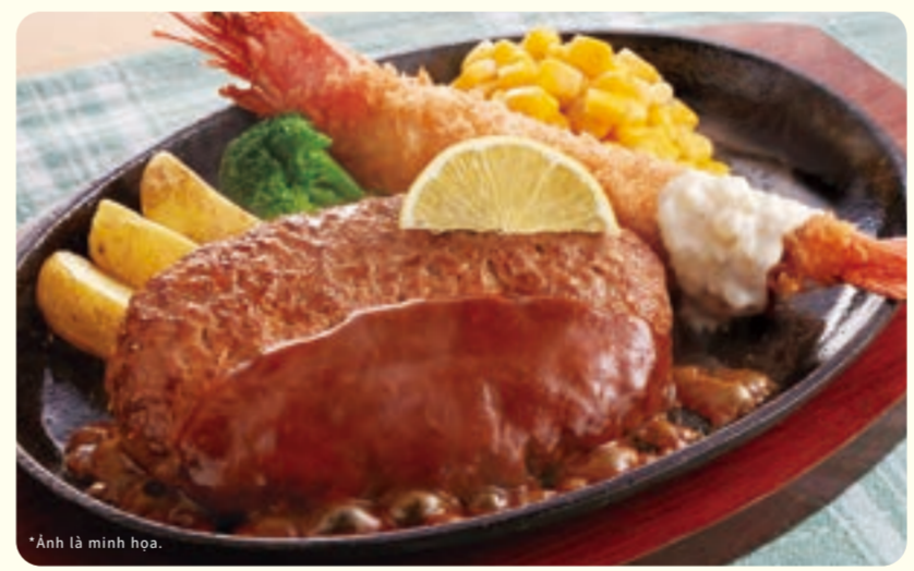
048 Demi-glance hamburger & tôm chiên đầu ¥1,099 (税込 ¥1,208)