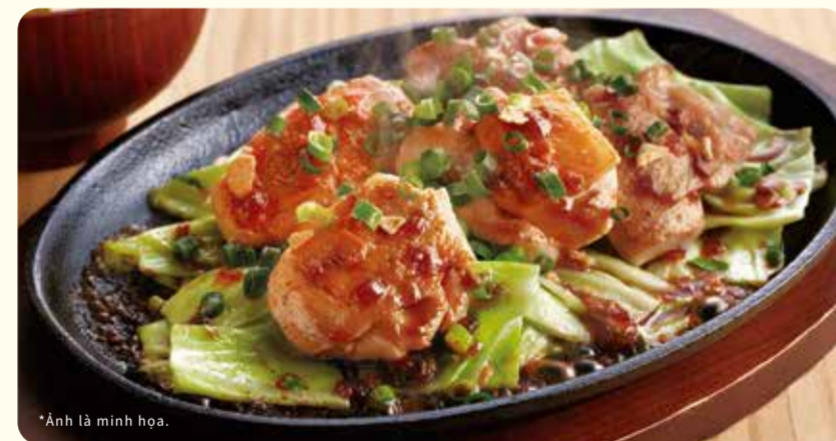
051 Một miếng gà bít tết sốt đậu nành ¥569 (税込 ¥625)