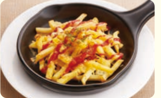
188 Khoai tây chiên phô mai (mayonnaise & sốt cà chua) ¥369 (税込 ¥405)

*Trọng lượng hiển thị cho khoai tây chiên cỡ lớn và khoai tây chiên là trọng lượng trước khi nấu.