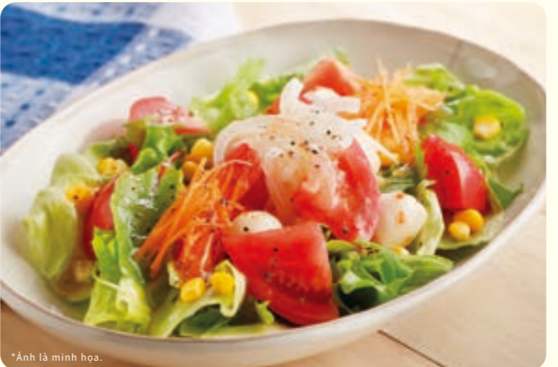
269 Salad cà chua và mozza anh đào kiểu Ý ¥539 (税込 ¥592)