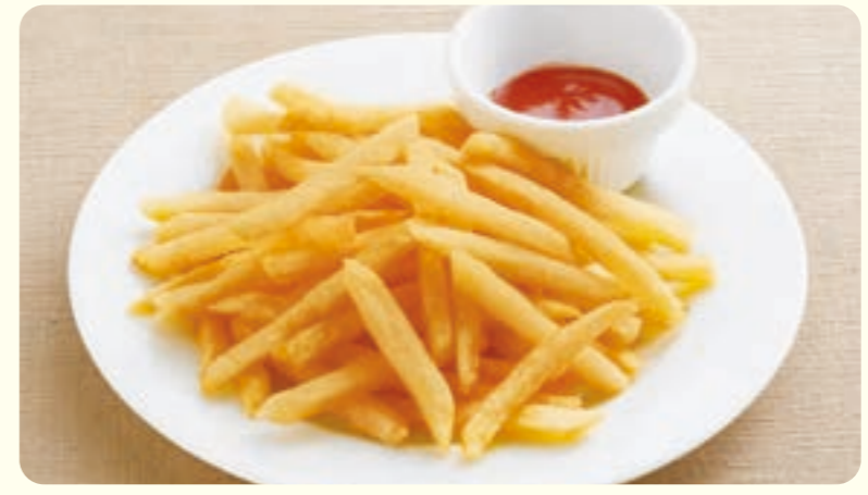
135 Khoai tây chiên (180g) ¥199 (税込 ¥218)