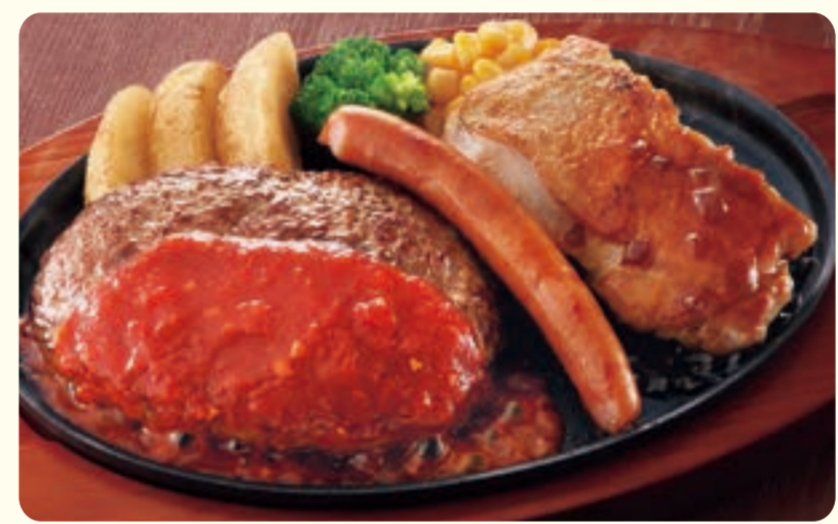
004 nướng hỗn hợp ¥799 (税込 ¥878)