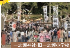
一之瀬神社・旧一之瀬小学校