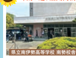
県立南伊勢高等学校 南勢校舎