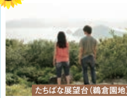
たちばな展望台(鶴倉園地)