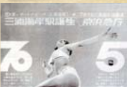
④ 駅開通当時の三浦海岸砂浜。記録的な好天にも恵まれたこともあって、ビーチは人の波にあふれた。 ⑤ 三浦海岸駅の誕生と海水浴をPRするポスターが華やかな当時の雰囲気を与えている。