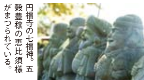
田福寺の七福神。五 穀豊穡の恵比須様 がまつられている。

ニユーの「自家製ベーコンと 新鮮野菜のサラダ」1300 円は、かむほどに野菜の瑞々 しさを実感できる。ジューシー な口当たりが自慢の「鮪ハチ ノコフライの定食」950円 もランチに最適だ。