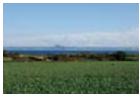
松輪や毘沙門の道路沿いには大根やキャベツの畑が連なり、ちょっとした小旅行気分が満喫できる。

【 Question 】 「 剣埼灯台 」へ。1871年(明治4年)に建てられた灯台で、東京湾の入口という要所にあり房総半島を一望できる。