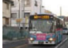
銚崎 三崎東園行き バスは本数が少 なく時刻表に注意。