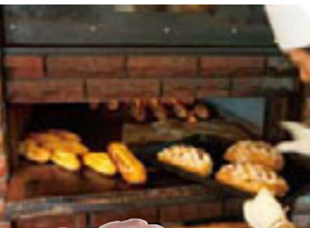
遠赤外線効果で、小麦本来の風味が引き立つ。

下町風情の色濃い仲木戸駅周辺には、昔ながらのシブ～いスポットが数多くある。今春大学を卒業したばかりの新人隊員が、隊長の命をうけ、“大人の夏休み”を探しに出発した!