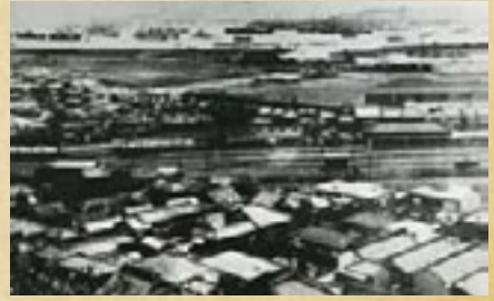
明治時代の神奈川停留所(現神奈川駅~仲木戸駅)周辺。

江戸時代に将軍の宿泊施設である神奈川御殿があり、柵を作った門を設けて警護したことが地名の由来とされる。開業当初の駅名は「中木戸」だったが、大正時代に現在の「仲木戸」に変更された。今年5月16日のダイヤ改正に伴い、8両停車ホームへと拡張工事が行われた。