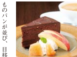
「リンクサイドカフェ」のケーキセット450円。ケーキは3種から選べる。食事メニューも充実。

なった今年、夏休みはいつた何日あるのやら：と不安げなAに、隊長が「仲木戸で大人の夏休みを探してきて」と指令。「えっ、夏休み?!」。その言葉に反応。ウキウキ気分で仲木戸駅に降り立った。