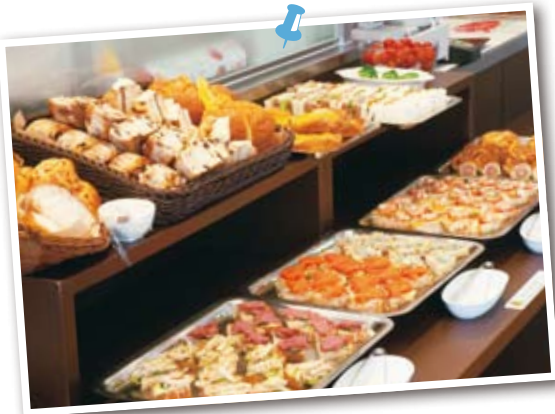
「Sandog Inn 神戸屋 東神奈川駅店」。県内ではここだけというランチbuffetは11時～14時（L.O.13時30分）。サンドイッチやカナッペ、菓子パンなど20種前後の料理が並ぶ。

⑥胡麻油ができるまでの工程を見学。所要約60分。⑦「純正胡麻油薄口」378円（140g）など商品も購入できる。