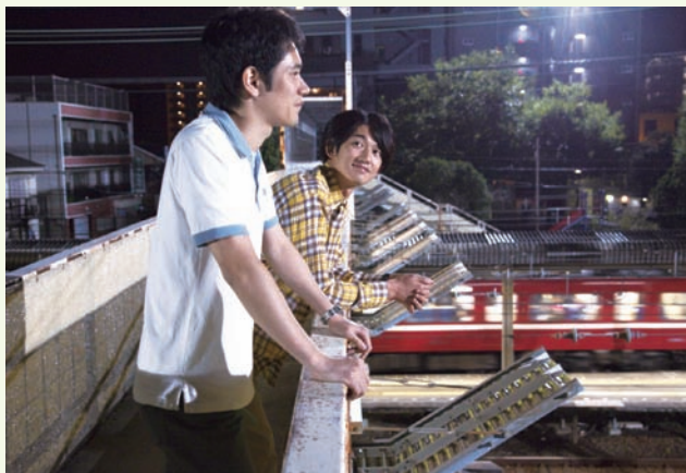
松山さん演じる小町が転がり込む「コダマ鉄工所」の寮は、六郷土手駅の近くにある設定に。(写真は神奈川新町駅)

【出演】松山ケンイチ、瑛太、貫地谷しほり、ピエール瀧、村川絵梨、伊東ゆかり、伊武雅刀、星野知子、笹野高史、西岡徳馬、松坂慶子 【脚本・監督】森田芳光 【音楽】大島ミチル 【主題歌】RIP SLYME[RIDE ON] (ワーナーミュージック・ジャパン/UNBORDE) 【配給】東映