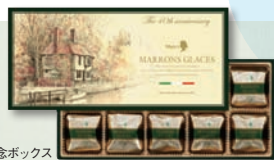
写真は記念ボックス

「マロングラッセ」は今年、モンドセレクション金賞を受賞し、全国百貨店でマロンフェアを実施。上大岡の京急百貨店でも発売。