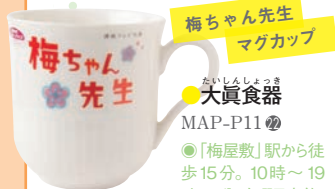
上質なボン チャイナ製。