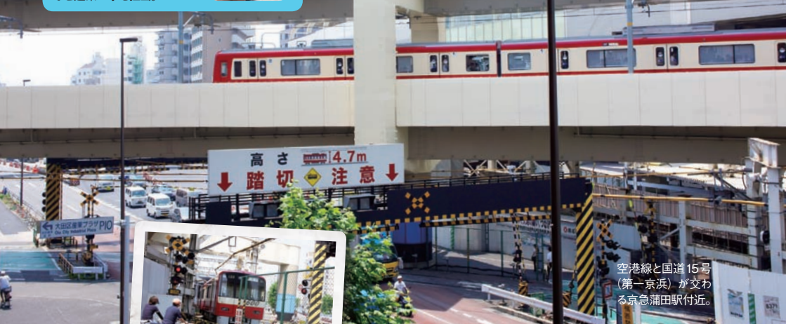
空港線と国道15号 (第一京浜)が交わる 京急蒲田駅付近。