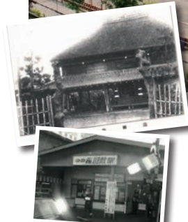
当時の梅屋敷(梅園)。(上) 1976(昭和51)年当時の梅 屋敷駅前。(下)

1972(昭 和47)年の新 日本プロレ ス旗揚げ興 行など、幾 多の名勝負 が繰り広げ られた伝説 の地である。 また、時を の試合も開催された。 老朽化により2009年に閉館。 約4年の月日をかけ、今年6月「大 田区総合体育館」としてリニューアル した。バスケットボールコート2面分 の広さを誇るメインアリーナをはじめ、 弓道場なども併設する、大田区 の新たなスポーツのメッカに。 今後も各種スポーツイベントがめじ ろ押し。みんなで足を運ぼう!