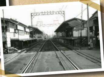
1975(昭和50)年当時の様子。その後1984(昭和59)年に改修工事が行われた。