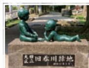
『旧呑川緑地』は地元っ子にとってのホームグラウンドだ。

たり遊具で遊ぶ子どもたちと一緒ににはしゃぎ童心にかえる隊員。ふと耳に飛び込んできた