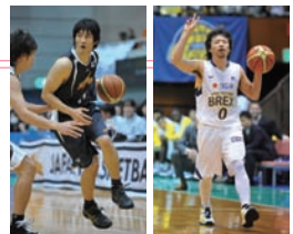
リンク栃木ブレックスの田臥勇 太選手(右)とトヨタ自動車アル バルクの岡田優介選手(左)。

収容人数4,000人規模を誇る大田 区総合体育館では、10月5日(金) にJBLリーグの開幕戦が行われる。昨シーズンのチャンピオントヨタ 自動車アルバルクと、元NBAプレーヤーのスーパースター田臥勇太 選手を要するリンク栃木ブレックスが激突。当日は開幕戦ならではの セレモニーも実施される。8チームによる6回戦総当りのリーグ戦、 全168試合中11試合(期間は~2013年3月24日(日))が大田 区総合体育館にて行われるので、ぜひこの会場へ!