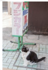
「ラッキー」の看板猫はなんと5匹も!