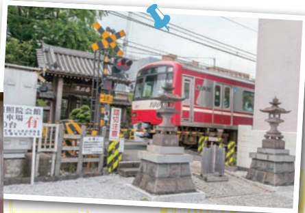
「遍照院」前を電車が通過していく。撮り鉄の人気スポット。

情報を得て向かった「 遍照院 」。なんと山門手前に踏切が……。京急の電車が次々通り過ぎる。江戸時代以前の創建という古刹と、真っ赤な電車のコントラストは、ほかでは見かけない光景だ。 探検の最終地点は「 子安台公園 」。急坂を上りたどり着くと、子安の工場群が目前に！その先にはベイブリッジ。夜は工場夜景がキレイだろうな♡ 任務を終えて、取り残されスボットとは、人が思い出を「残