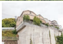
切り立った崖の上の家。隣が公園だ。