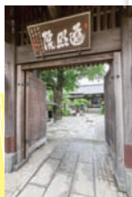
その立地から「踏切寺」の愛称でも親しまれる。