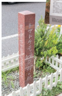
トマト色の赤御影石で作った「トマトケチャップ発祥の地碑」。