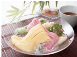
香りと色彩を備えた「池利」の手延べ三輪素麺・三輪の四季]5,400円。