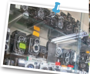
今では珍しい二眼レフなど、見ているだけでも楽しい。