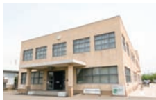
建物は近代化産業遺産に認定。

自動車やエンジンの仕組みを学べる展示のほか、歴史年表なども。創業当初の生産風景の映像など、貴重な資料も見逃さない。※予約不要。10時～16時、日曜日休館（祝日は閉館の場合あり、要問合せ）。見学無料。