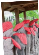
「遍照院」境内に佇むお地藏さん。