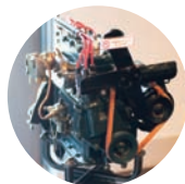
「ダットサン7型」のガソリンエンジン。

技術の進化とともに性能・構造が変化していった歴代日産車のエンジン28台を展示。自動車の心臓部にあたる約300台のエンジンが収蔵されており、毎年一部入替が行われる。旧型から、最新スポーツカーまでエンジンの進化が一目瞭然！