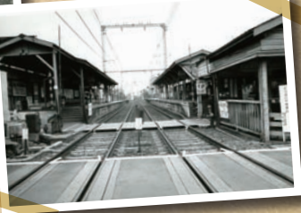
1977 (昭和52)年のホーム。橋上駅舎になる前はホーム間を改札内踏切で渡っていた。