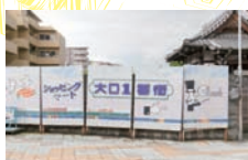
子安駅のガードをくぐる とゆるい看板が登場。

今回は子安～京急新子安周辺で「取り残されスポット」を探れ!との指令。た、隊長……、いつにも増してマニアック