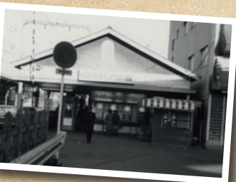
1976 (昭和51)年の駅舎の様子。当時は平屋で、改札に入ってすぐホームだった。

1976 (昭和51)年に京急電鉄入社。運転士、乗務員、駅勤務、助役とひと通りの駅業務を経て、2013年9月から現職に就いた。