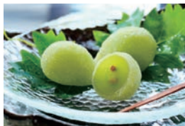
口内でマスカット果汁が弾ける「宗家源吉兆庵」の「陸乃宝珠」3,456円。

京急百貨店では7F催事場にて、「2014 お中元ギフトセンター」を開設しています。今夏は、全国から「夏の涼味」を厳選した商品や、泉岳寺～三崎口間の「京急沿線うまいもの」を集めてみました。お出かけや、帰省など人と会う機会に取り寄せて、一緒に楽しめるような商品も充実させています。お得な「全国配送送料無料ギフト」も約340種ご用意。ぜひ、お中元は京急百貨店をご利用ください。