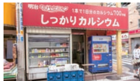
明治牛乳の直売所なので、牛乳のほかヨーグルトなどもスーパーで買うより安い。

●「糺谷」駅から徒歩5分。6時～18時、日曜日定休。大田区萩中2-8-12 / Tel. 03-3742-2572