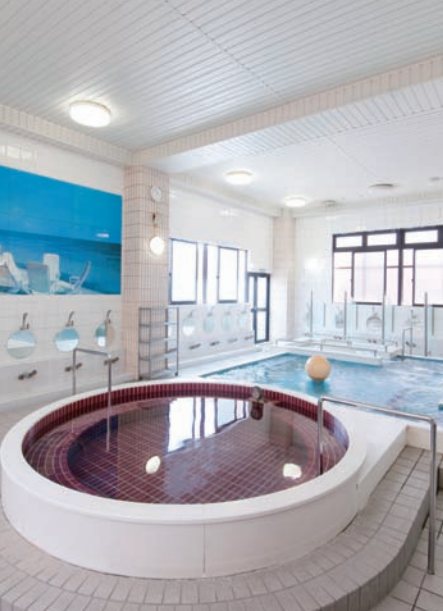
採光を工夫した浴場は、6種類の湯船を備える。