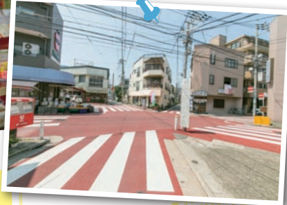
全国でも珍しい七叉路。張り巡らされた電線にも注目！

らす糶谷を象徴するのがこの七辻なのかもしれない。なんだか心がほっこりした探検隊でした。