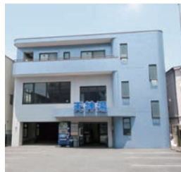
広々とした駐車場があるので、土・日曜日には小さい子連れの家族も、車で訪れる。