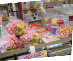
お手玉やリリアンなど女性には懐かしいおもちゃも。