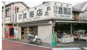
江戸時代に建てられ、関東大震災や戦災もくぐり抜けてきた、立派な家屋。

●「糺谷」駅から徒歩11分。9時～21時、無休。大田区西糺谷2-17-22 / Tel.03-3741-0321