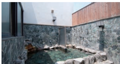
住宅街の露天風呂では珍しく、青空を見ながら浸かれる。

●「糺谷」駅から徒歩10分。14時～24時、(土曜日、祝日は12時～、日曜日は9時～)木曜日定休。入浴料460円。大田区南蒲田1-7-23 / Tel.03-3731-7069