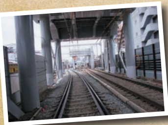
線路が高架になったことで踏切が減り渋滞の大幅な緩和が実現した。

1977(昭和52)年に京急電鉄へ入社。駅勤務、車掌、運転士、本社勤務を経て2011年3月16日より現職に就く。