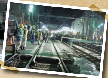
2007年、高架化工事のため敷かれていた仮線路の切り替え工事は、夜間に行われた。