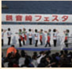
※写真はどちらも2006年のものです。

「観音埼灯台」の建立にちなんだ「観音埼灯台まつり」と、毎年4月に行われていた「県立観音崎公園まつり」を一度に楽しむよう開催したのが「観音崎フェスタ」。2003年から始まり第6回目を数える今年も、11月上旬に県立観音崎公園内の観音崎園地で開催される。地元ならではの愉快なイベントも注目され、昨年(2006年)は約2万5000人もの見物客が訪れたそう。なかでも、「ガリバー旅行記」のガリバーが観音崎に上陸したとの話をもとに催す「ガリバーアンタジー」は、ガリバーと踊る子どもたちがかわい。ガリバー上陸300周年を迎える来年に向け、今年の期待がよりふくらむ。