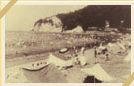
昭和30年代の馬堀海水浴場