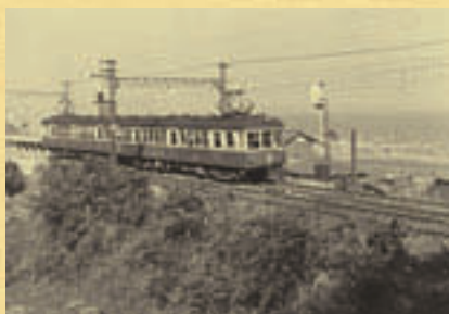
線路のすぐ向こうに海が広がる昭和30年代の馬堀海岸駅付近