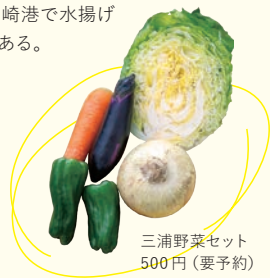
三浦野菜セット 500円(要予約)

BBQの素材は現地調達で、ぐるりと海に囲まれた三浦半島は、海の幸はもちろんのこと、温暖な気候を生かした露地栽培の野菜もおいしい。キャンプパークに隣接する観潮荘では、三崎港で水揚げされた魚介類を販売する直売所がある。