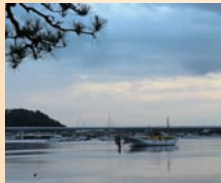
左／歌川広重作・金沢八景「野島夕照」○、右／夕暮れ時に琵琶島から見た現在の野島。

財30件近くを含む2万点以上の所蔵品を有し、見応えのある展示を展開しています。 「金沢八景」の地は古来より風光明媚で知られ、江戸時代に一大観光名所となりました。8つの景勝を描いた歌川広重の浮世絵は絶大な人気を集めました。 埋め立てによって大きく様変わりはしたものの、往時を偲ぶ二