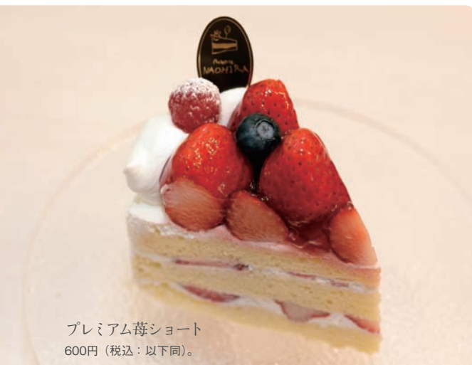
プレミアム苺ショート 600円(税込:以下同)。