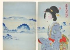
「名勝美人会 武蔵金澤」(揚州周延 明治31年)。*

じ年に開通した湘南電鉄(京急電鉄の前身)の駅を「金沢文庫」と名付けたのは、この復興を記念してのことだったのかもしれません。 「金沢文庫は武家の文庫ではありませんが、平安時代の公家の文化も受け継いでいるんですよ」と金沢文庫学芸課の山地純さん。収蔵本の中には宮中の女房ファッションに関する記述が遺されているものもあるのだとか。現在、国宝2件、重要文化