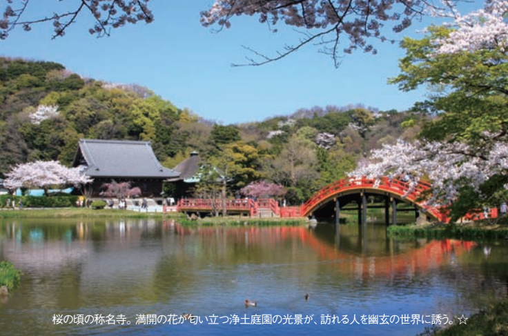
桜の頃の称名寺。満開の花が匂い立つ浄土庭園の光景が、訪れる人を幽玄の世界に誘う。☆