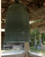
下／歌川広重作・金沢八景「称名晩鐘」○、右／称名寺の鐘。