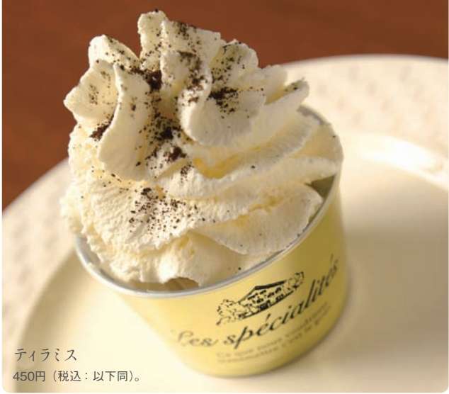
ティラミス 450円（税込：以下同）。