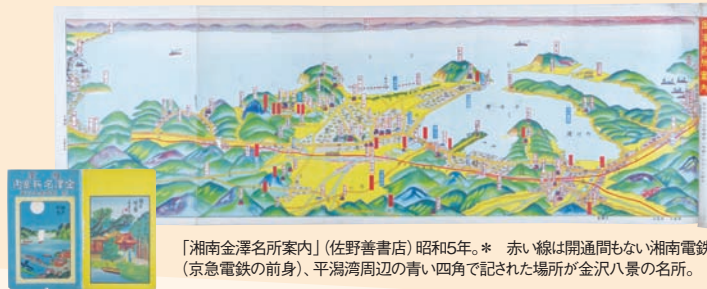
「湘南金澤名所案内」(佐野善書店)昭和5年。* 赤い線は開通間もない湘南電鉄(京急電鉄の前身)、平潟湾周辺の青い四角で記された場所が金沢八景の名所。