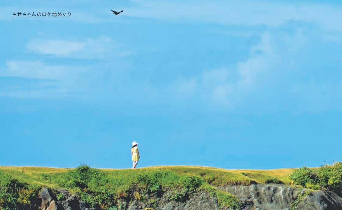
一色海岸と大浜海岸の境にある小高い丘。先端には磯遊びができる岩場があり、御用邸も近く、パワースポットとしても有名。