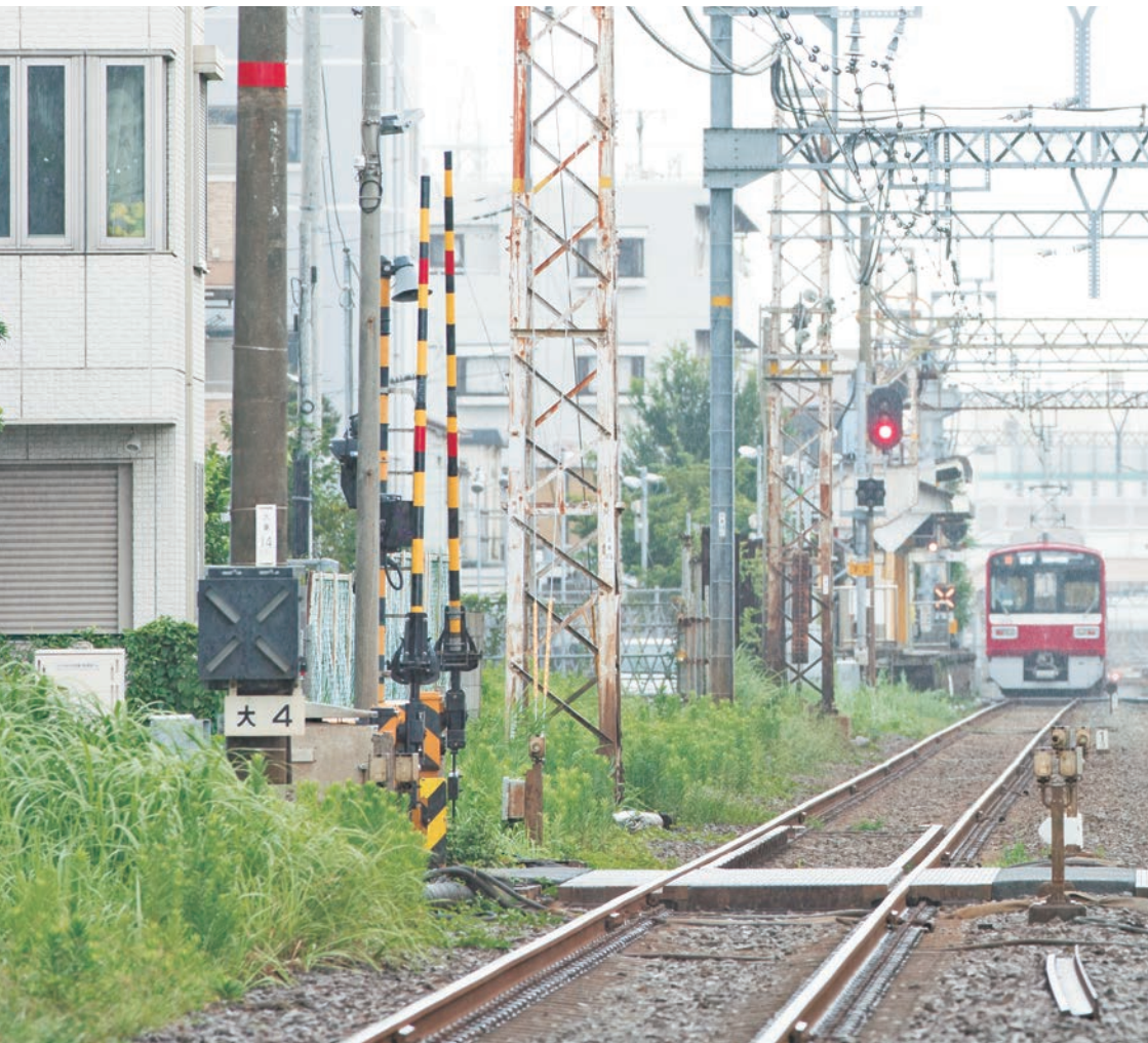
川崎大師駅と東門前駅の間にある踏切で。高架化が進み、今では見かけることが少なくなった踏切の風景は主人公サヤカの思い出の場所として、映画の中で何度も登場する。