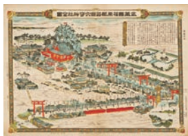
明治30年代の穴守稲荷神社周辺。穴守線の開通により、都心からの参拝客でもにぎわうようになり、茶屋や土産物屋が立ち並び、門前町や鉾泉街がつけられ、一大行業施設に。