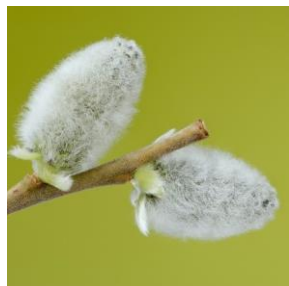
Selje - Salix caprea 3