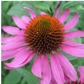
Purpursolhatt - Echinacea purpurea 2