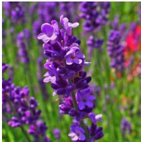
Lavendel - Lavandula angustifolia 2