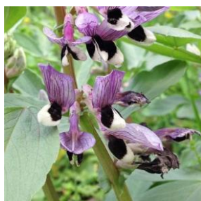
Bønnevikke – Vicia faba 2