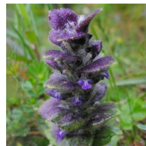
Jonsokkoll - Ajuga reptans 1