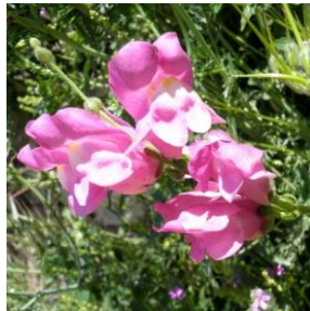
Løvemunn - Antirrhinum majus 2