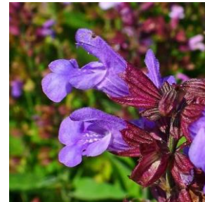
Salvie - Salvia officinalis 2