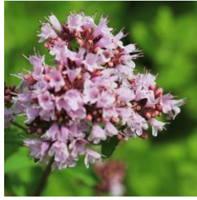
Bergmynte - Origanum vulgare 2