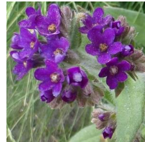
Oksetunge - Anchusa officinalis 1