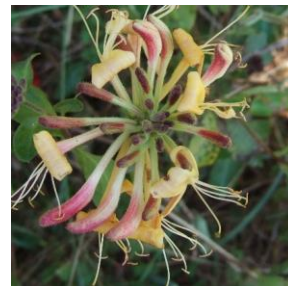
Vivendel - Lonicera periclymenum 1