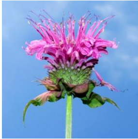
Hestemynte - Monarda didyma 2