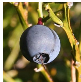
Bærbusker og frukttrær 2