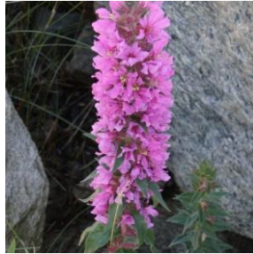
Kattehale - Lythrum Salicaria 1