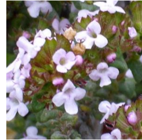
Kryddertimian - Thymus vulgaris 2