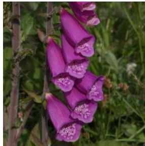
Revebjelle - Digitalis purpurea 1