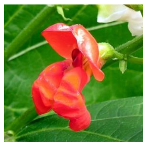
Bønner – Phaseolus spp. 2