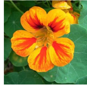
Blomkarse - Tropaeolum majus 2