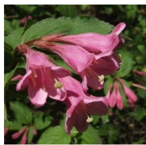
Klokkebusk - Weigela florida 2