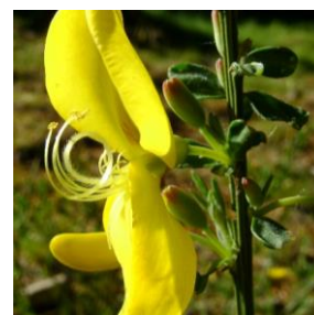
Gyvel - Cytisus scoparius 2