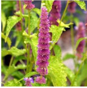
Anisisop - Agastache foeniculum 2