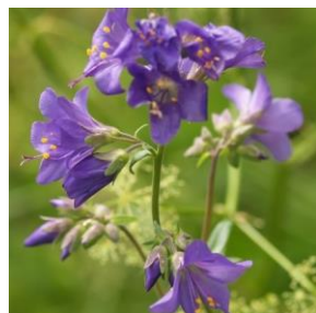
Fjellflokk - Polemonium caeruleum 1