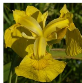
Sverdlilje - Iris pseudacorus 1