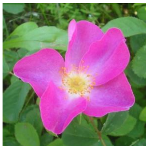
Roser - Rosa spp. 2