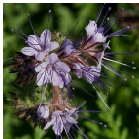
Honningurt – Phacelia tanacetifolia 1