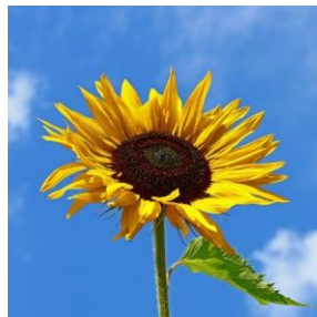
Solsikke - Helianthus annuus 2