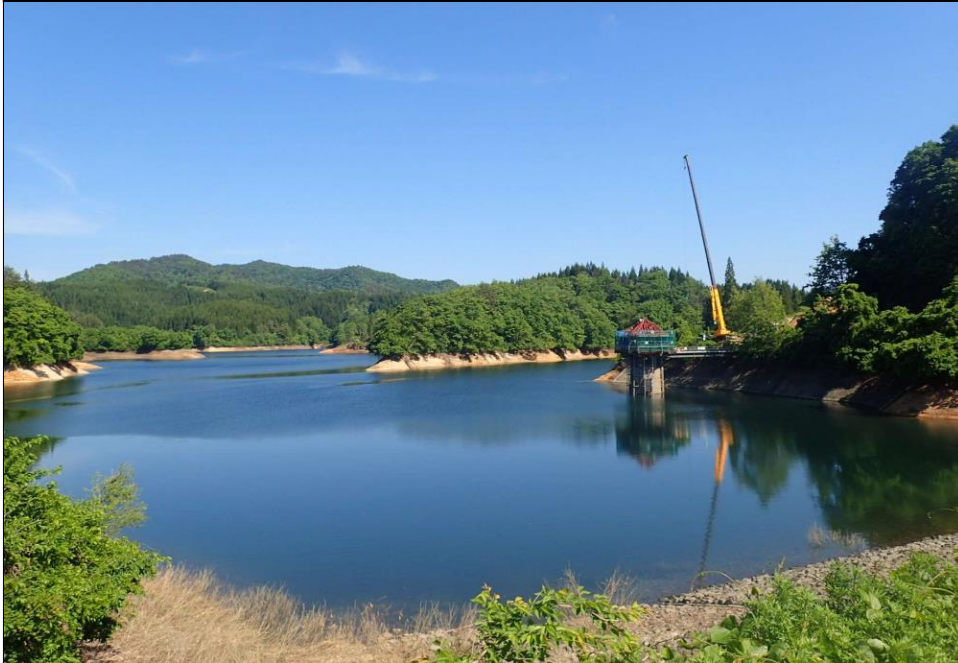
令和6年度施工状況 取水塔の建屋改修