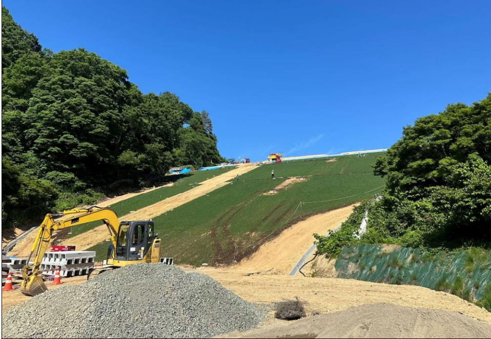
令和6年度施工状況 ダム堤体の整備