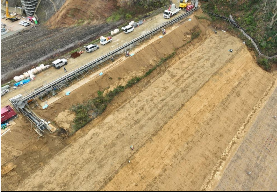
令和5年度施工完了後 ダム堤体の耐震補強