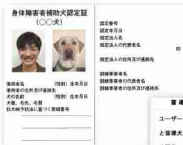
(左上) 身体障害者補助犬認定証