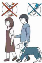
不慣れな場所への誘導

お困りの様子が見られたらユーザー本人に「何かお手伝いしましょうか」「どのようにお手伝いすればよろしいですか」などの声かけや筆談でコミュニケーションをとりましょう。