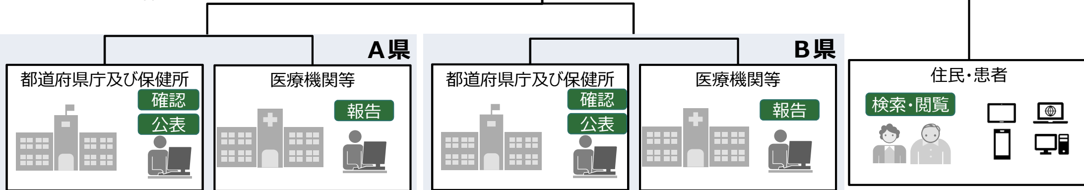
図 全国統一システムによる制度運用イメージ