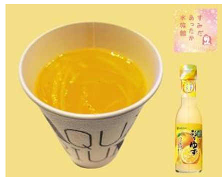
あったかゆずはちみつドリンク