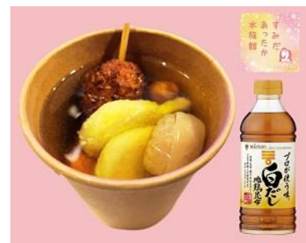
すみだあったかおでん