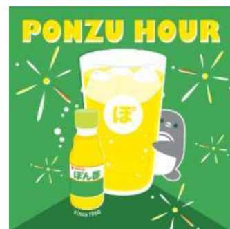
オリジナルコラボステッカー

※ステッカーの数には限りがございます。無くなり次第、ステッカープレゼントは終了とさせていただきます。