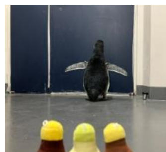
ぼんずの初めてのプールデビューを応援 (ミツカン公式 X より)

2023年3月25日に、すみだ水族館にマゼランペンギンの赤ちゃん「ぼんず」が誕生しました。お父さんペンギン「ゆず」とお母さんペンギン「ラムネ」から生まれ、“ぼんっ”という明るい音が、元気な赤ちゃんにぴったりなことから、「ぼんず」と命名されました。「ぼんず」の誕生をきっかけに、SNSを通じた交流がスタートし、「ぼんず」と「ぼん酢」の様々なコラボを実施しています。