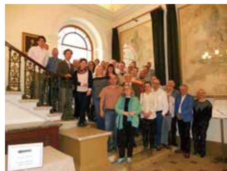
英国地質学会における国際学術委員会

特定の専門分野について深く議論する会合もあります。RILEM（国際材料構造試験研究機関・専門家連合）という学術団体があり、この中にコンクリートの劣化反応のひとつ、アルカリ骨材反応の抑制について議論する技術委員会があります。写真はロンドンで開催された会合の集合写真です。世界中から研究者が半年に1回程度集まり、専門的議論を行っています。これらの最先端の国際的知見を多くの研究者と交流することで知見を広め、環境回復に役立てるべく研究を進めています。