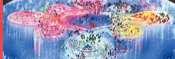
26年はミラノ・コルティナダンペッツォで開催