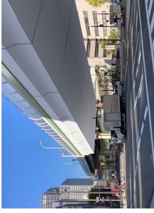
常設足場設置イメージ

工事内容：難波交差点直上に位置する阪神高速道路の橋桁63.4mに、維持管理性の向上及び 美装化を目的とした常設足場を設置します。