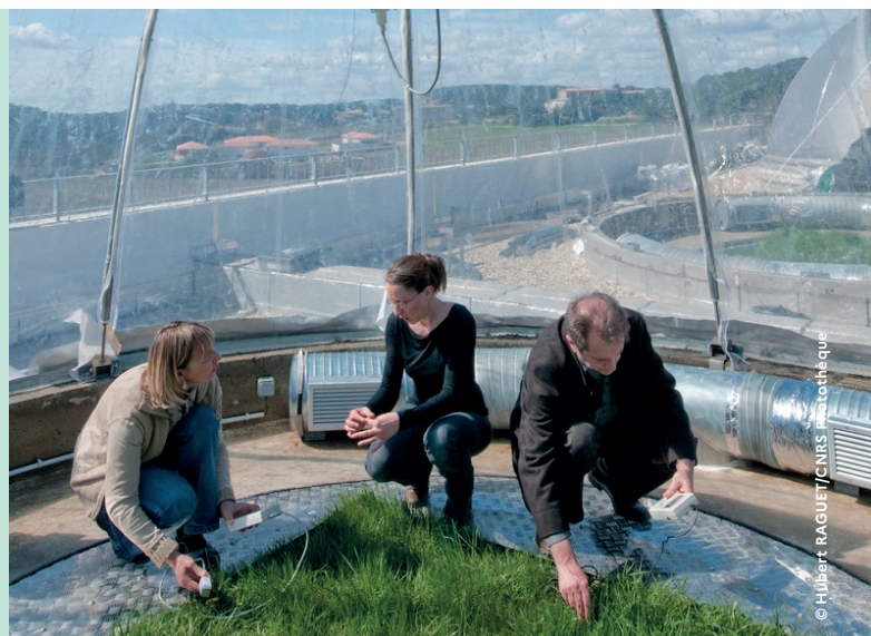
Observation du comportement des plantes à l'Ecotron européen de Montpellier