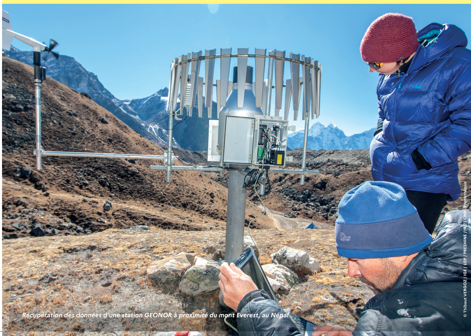
Récupération des données d'une station GEONOR à proximité du mont Everest, au Népal