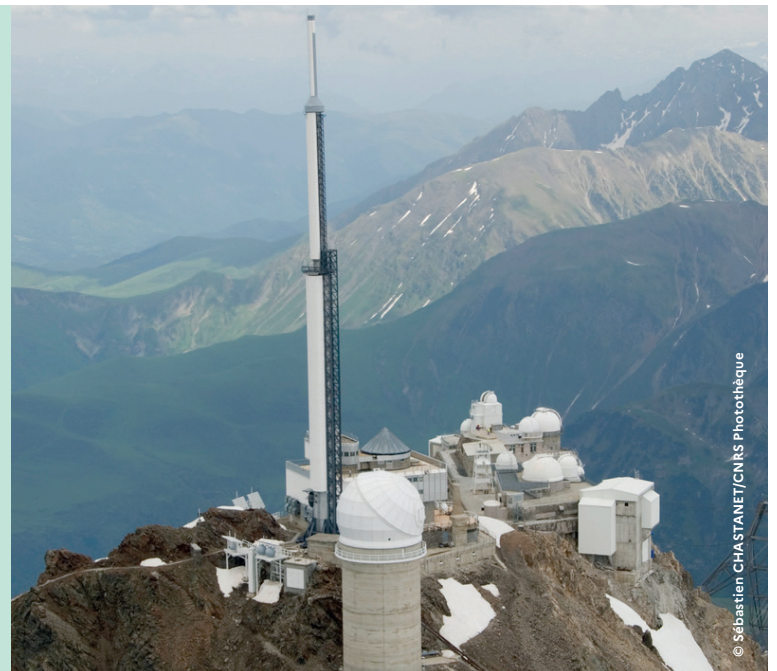
Vue aérienne de l'Observatoire du Pic du Midi