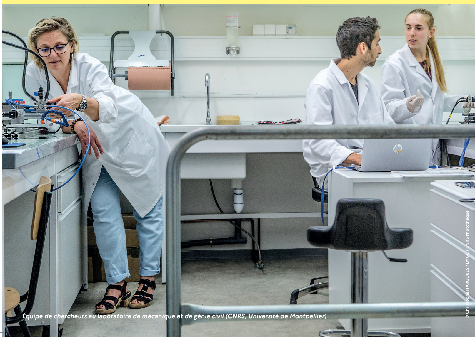
Équipe de chercheurs au laboratoire de mécanique et de génie civil (CNRS, Université de Montpellier)