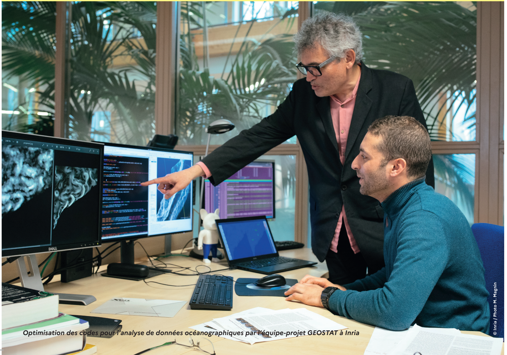
Optimisation des codes pour l'analyse de données océanographiques par l'équipe-projet GEOSTAT à Inria