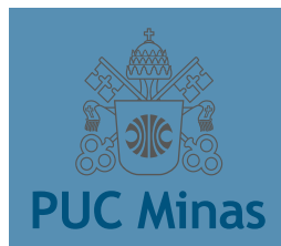
Versão inadequada sobre fundo cromático