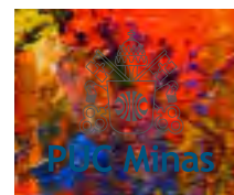
Brasão em fundos coloridos