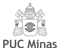
80% de preto