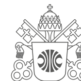
Brasão sem o termo PUC Minas