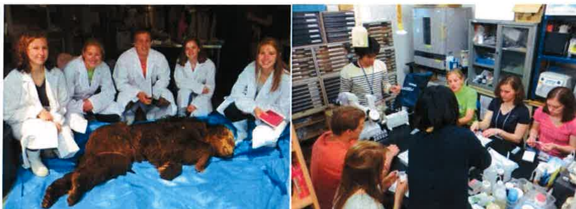
図13. 米国フィンドレー大学野生動物医学研修（左：剖検研修に用いた昭和神山クマ牧場ご提供頂ヒグマの前、右：麻酔用吹き矢作製研修の様子）