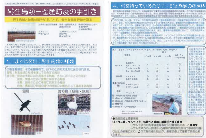
図7. 道立総合研究機構作成「野生鳥類一畜産防疫の手引き」の表紙(左)とWAMCが担当・協力をした頁(右)

2014年3月に終了した北海道立総合研究機構重点研究「野生鳥類由来感染症の伝播リスク評価及び対策手法の開発」で、畜舎に忍び込む野鳥の感染リスクについてまとめたパンフレット作成に協力した。このパンフレットのうち、WAMCが担当・協力したのは野鳥で報告のある病原体一覧で、これらに起因する疾病のうち、家畜衛生上、警戒すべき感染症についてリスク評価を行ったものであった(図7)。まだまだ十分とは云えないものの、類似したものは無く、各方面で活用されることを望みたい。なお、この研究に関して、表1で示したように国内外の学会などで発表されたもののほか、戦略研究とも関連して刊行された原著・総説類[6, 9, 20, 25, 30, 41, 50]などもあわせて参考にして頂きたい。