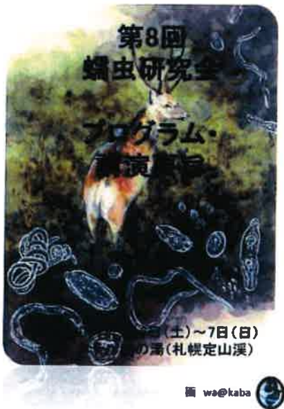
図16. 第8回蠕虫研究会札幌大会の講演プログラム・要旨集の表紙(宮崎大学医学部寄生虫学教室の公式ホームページにはこの改訂版全文が掲載されている)

昨年から、学会研究会の学術集会を主催することが急増し、今年は、9月、第8回蠕虫研究会札幌大会をお世話した。要旨集はこの研究会の事務局である宮崎大学医学部寄生虫学教室の公式ホームページ http://www.miyazaki-med.ac.jp/parasitology/zenchu/program&abstracts_2014.pdf に掲載されているので、ご覧下さい。来年は第21回日本野生動物医学会江別大会(大会専用は http://www.knt.co.jp/ec/2015/jjzwm/index.html 、親学会のものでは http://www.jjzwm.com/guidance.html )を主催予定であるので、この機会に参加をご検討下さればと思う。