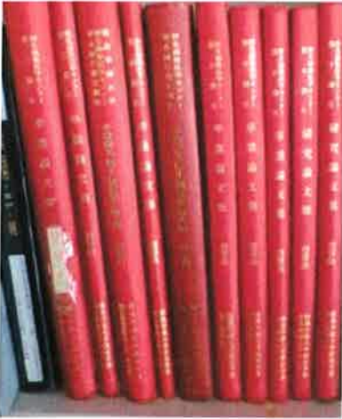
図2. WAMC 研修室にて閲覧される第10期生までの卒論・研究論文集