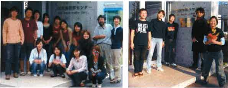
図3. WAMC 年度報告に未掲載であった初期メンバー集合写真(左: 第1・2期生、撮影2004年夏; 右: 第3・4期生、撮影2006年秋)