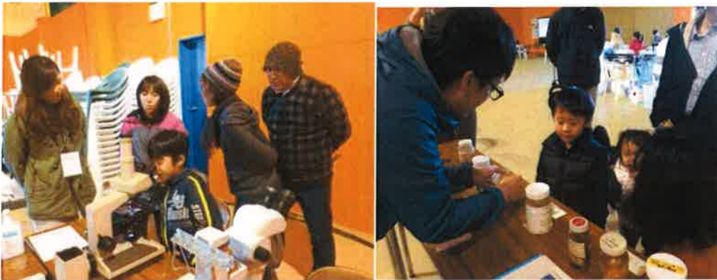
図15. 円山サイエンス ZOO 出展ブースで野生動物の寄生虫を説明する WAMC メンバー (いずれの写真も左端人物)

る。顕著な例が、彼ら独自に札幌市円山動物園の啓発事業「円山サイエンス ZOO」(10月、詳細は公式ホームページ http://www.corner-maruyama.com/contents/calendar/2014_08/topic20140831_002418.html 参照)に出展したことであった(図15)。これは昨年が続いてであるが、このような積み重ねはWAMCと地元地域住民との連携強化に直結し、かつ彼ら学生は野生動物医学が人間社会に深く関連を持つ「ヒト臭い応用科学」であることを会得するのであろう。