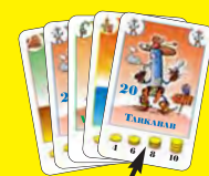
Ez az első lap!