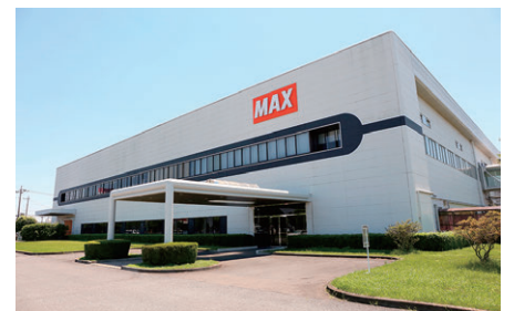
記載内容は取材時現在の情報です。