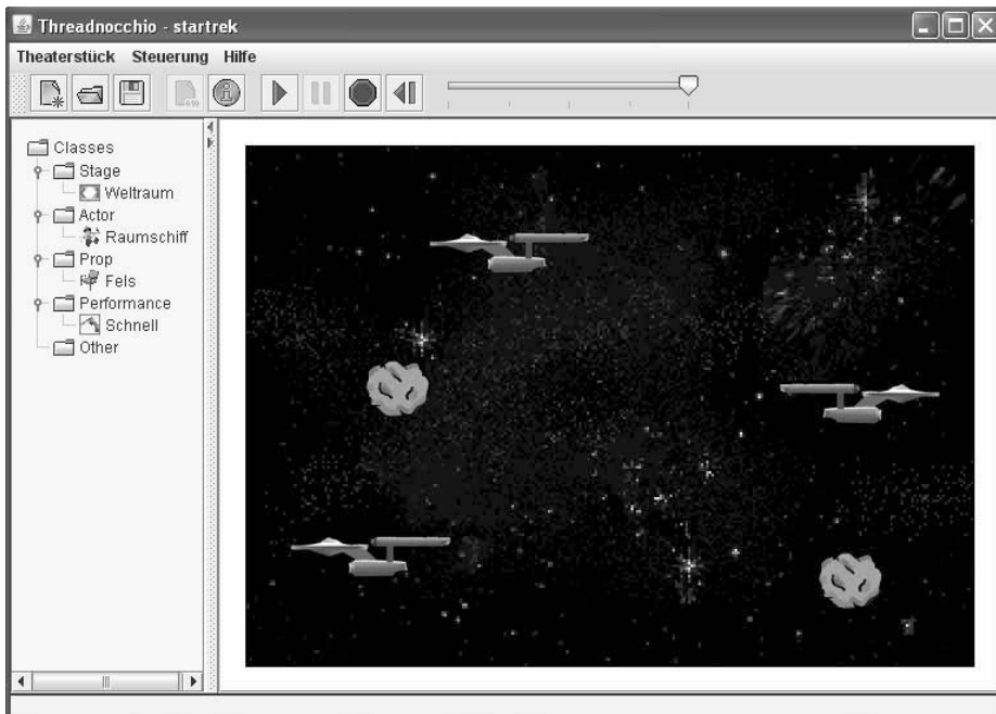
Abb. 2 Threadnocchio-Simulator mit Startrek-Theaterstück

TheaterImage ist eine Theater-Klasse mit vielfältigen Methoden zum Erzeugen und Manipulieren von Bildern bzw. Icons, die dann Akteuren, Requisiten oder der Bühne zugeordnet werden können. Die Bilder lassen sich dabei auch noch zur