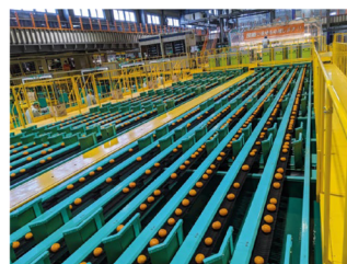
Sistema de triagem para produtos agrícolas