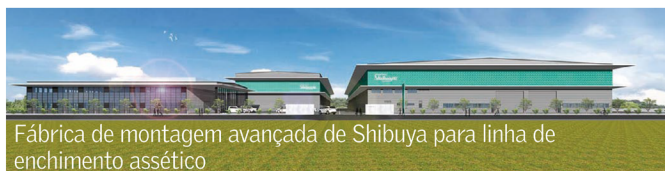
Fábrica de montagem avançada de Shibuya para linha de enchimento asséptico