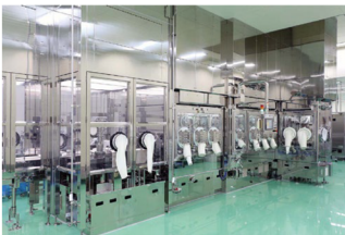
Hệ thống chiết rót vô trùng/hiếm vi khuẩn cho thuốc chống ung thư

Được thành lập vào năm 1931, Tập đoàn Shibuya là nhà cung cấp hàng đầu các hệ thống đóng chai và đóng gói đã được khách hàng thử nghiệm và tin tưởng trong ngành đồ uống, thực phẩm, mỹ phẩm, chất bán dẫn, nông nghiệp và chăm sóc sức khỏe. Công ty Nhật Bản này bắt đầu cung cấp các hệ thống đóng chai của mình cho một công ty sản xuất rượu sake và sau đó mở rộng hoạt động sang lĩnh vực kinh doanh đóng chai, bao gồm sản xuất máy rửa chai, máy độn, máy đóng nắp, máy dán nhãn, máy đóng hộp, máy xếp khay và hệ thống đầu tiên trên thế giới có thể xử lý nhiều loại bình chứa, từ 180ml đến 1800ml, trên một máy duy nhất vào đầu những năm 1960.