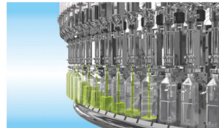
Hệ thống chiết rót PET vô trùng cho đồ uống và các sản phẩm từ sữa

bật của chúng tôi. Tầm nhìn của tôi là mở rộng công nghệ cốt lõi này sang các thị trường mới trên toàn thế giới,” chủ tịch tiết lộ. “Chúng tôi hiện đang tạo nên những bước phát triển mới với một số đối tác kinh doanh trong các lĩnh vực như chế biến vô trùng, được sử dụng cho các hệ thống đóng chai và dược phẩm của chúng tôi. Thông qua phối hợp hợp tác giữa các công ty thuộc tập đoàn Shibuya, chúng tôi có tiềm năng mở rộng kinh doanh trong lĩnh vực y học tái tạo, chất bán dẫn, chế biến thực phẩm và dược phẩm.”