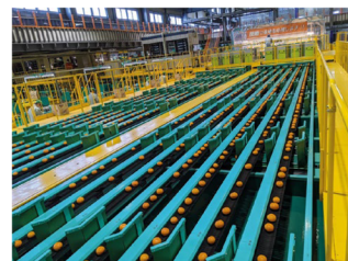
Hệ thống xếp loại & phân loại nông sản