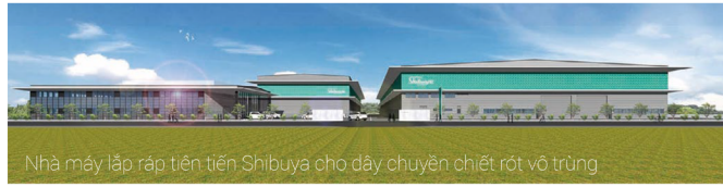
Nhà máy lắp ráp tiên tiến Shibuya cho dây chuyền chiết rót vô trùng

Với công nghệ cốt lõi là hệ thống đóng chai, tạo thành nền tảng cho các sản phẩm sáng tạo của mình, Shibuya đã mở rộng ứng dụng của các sản phẩm sang một số ngành công nghiệp trong những năm qua, bao gồm sản xuất chất bán dẫn và gần đây nhất là y học tái tạo. Chủ tịch công ty Hidetoshi Shibuya cho rằng thành công của Shibuya có ba yếu tố chính: “Thứ nhất, thái độ nghiêm túc của chúng tôi đối với nghề thủ công