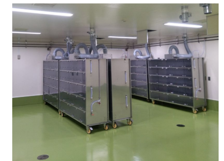
■ 2階 マウス飼育室(2) 飼育ケージ