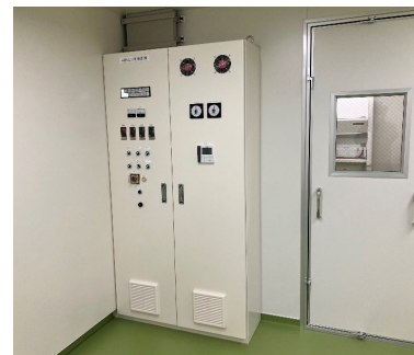
■ 1階 ABSL3 制御盤