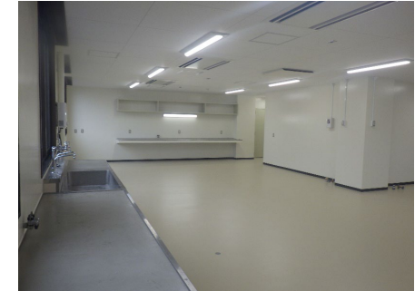
■ 2階 共同実験室