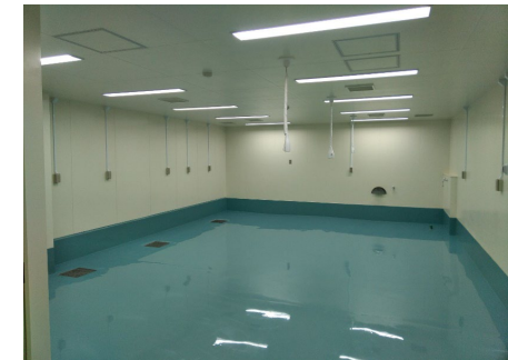
■ 1階 大動物手術室