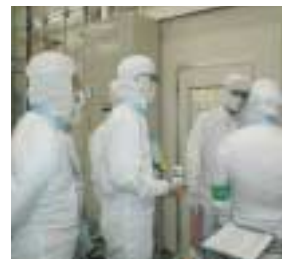
現場でのアセスメントの様相

EHSマネジメントシステムを強化するため、システムや成果のチェック機能を担う監査のレベルアップを図っています。監査は事業所内やグループ内で、あるいは第三者により複合的に行われています。特に積極的に推進しているのは、2002年度に開始した各事業所のEHS代表者による相互監査、「TELインターナルアセスメント」です。2004年度は、労働安全衛生と作業安全という従来の項目に、「装置EHS Compliance」「装置EHSパフォーマンス」「環境パフォーマンス・遵法」の各項目を追加しました。これにより個々の装置の環境・安全性のチェックや事業所の環境マネジメントを相互にチェックできる体制を強化しました。