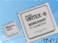
ザイリンクス社 Virtex®-6 FPGA