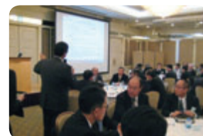
取引先とのテーブルディスカッション

EHSに配慮した調達など私たちの使命の実現のために、取引先との協業と連携を図り、ともに成長していきます。