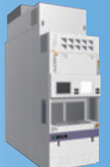
TELINDY PLUS® 熱処理成膜装置