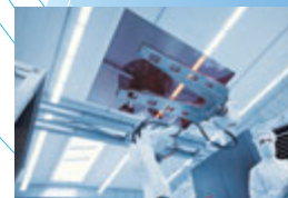
Oerlikon Solar Ltd. KAI (PECVD)