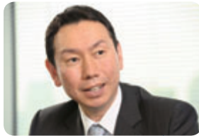
太陽電池製造装置事業を強化します