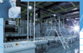
Oerlikon Solar's Fab 1200