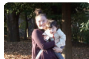
育児休業制度拡充を進めました

社員一人ひとりが能力を最大限に発揮できるように、働きやすい職場づくりの実現を目指しています。