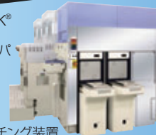
Tactras® プラズマエッチング装置