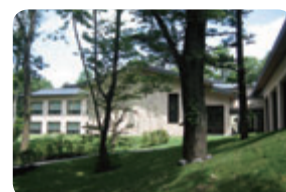
TEL UNIVERSITY 研修施設 軽井沢クラブ

社員の成長と組織の活性化を目指し、挑戦意欲、自主性を尊重する企業として、中長期的に人材の育成に取り組んでいます。