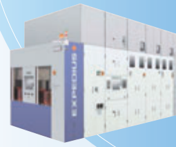
EXPEDIUS®+ オートウェットステーション