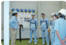
当社グループでの安全体感学習

企業の社会的責任の一つとして、企業活動にかかわるすべての人々の健康と安全に関する取り組みを推進しています。