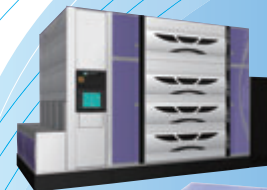
CLEAN TRACK® LITHIUS Pro® コータ/デベロッパ