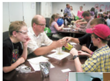
小学校の授業でのサポート風景

また、同社では社員に日々の生活で環境問題に取り組んでもらうために、イントラネットやニュースレターの配信を通じてカーシェアリングなど様々な情報提供を行っています。さらに、3R (Recycle, Reduce, Reuse)の取り組みに、社員同士で必要のなくなった物品の売買を奨励するRebuyを加えた4Rを推奨しています。社員同士での不要品の売買や、紙、ダンボール、カン、ビン、ペットボトル、電池や携帯電話などリサイクル可能な物資が社員の家庭でリサイクルできない場合、会社に持参するように促し、同社がリサイクルしています。