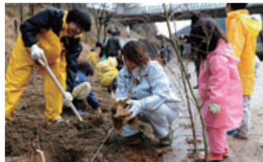
九州での植樹活動

また、アメリカでも植樹活動を行っており、テキサス州に拠点があるTokyo Electron U.S. Holdings, Inc.とニューヨーク州に拠点があるTEL Technology Center, America, LLCでは、社員ボランティアを募りオフィスの敷地内で植樹を行っています。