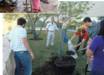
アメリカでの植樹活動