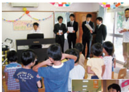
新入社員研修での社会貢献活動