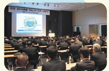
2010年度に開催した「TELパートナーズデイ」

※ EDI(Electronic Data Interchange) : 商取引に関する情報を標準的な書式に統一して、企業間で電子的に交換する仕組み