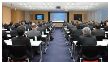
2011年度に開催した「TELパートナーズデイ」