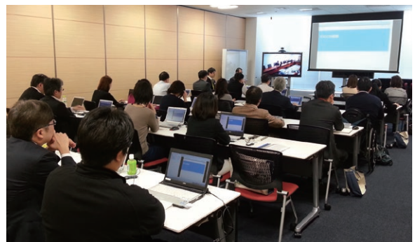
EICC ® 社内セミナーの様子

2014年1月には、外部講師を招いて、電子業界のCSR推進団体であるEICC ® ※が発行するEICC ® 行動規範についてのセミナーを開催しました。本社と国内、海外の拠点を中継し、およそ130名のCSR推進関係者が受講しました。