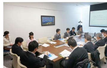
マテリアリティレビュー会議の様子 (2015年3月25日)