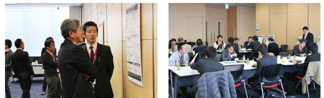
技術交流会の様子

当社グループでは、イノベーションの創出と情報資産の有効活用のため、お客さまや社内のコミュニケーションネットワークの構築が欠かせないと考えています。情報共有、多面的なコミュニケーションの場として社内外で開催する技術交流会は、参加されたお客さまおよび社員から好評を得ています。