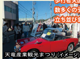
天竜産業観光まつり(イメージ)