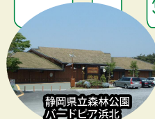
静岡県立森林公園バードピア浜北