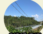
空の散歩道(吊り橋)