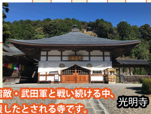
家康が宿敵・武田軍と戦い続ける中、陰で支援したとされる寺です。光明寺