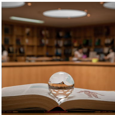
Biblioteca da Faculdade de Ciências da Saúde

Biblioteca Central Salas de Leitura: 9h00 às 17h30 Hall, Recepção, Salas de Trabalho Grupo: aberto 24 horas