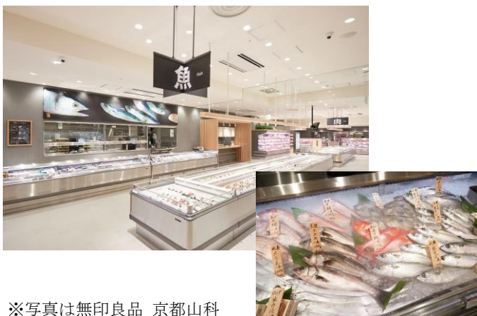
※写真は無印良品 京都山科