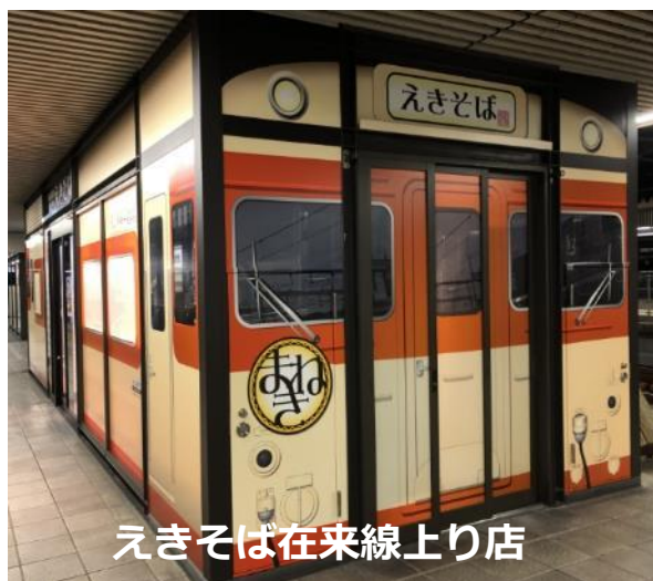
えきそば在来線上り店

とろとろの天ぷらに小エビがちらり。 かんすい入りのオリジナル中華麺使用。 まねきの看板商品です。