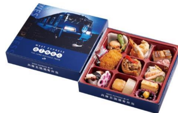
兵庫五国酒肴弁当