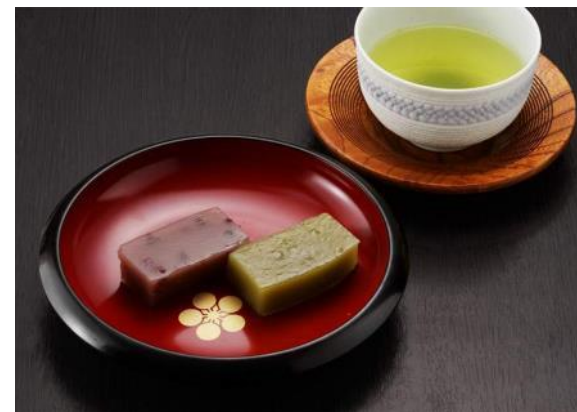
外郎ほか防府の土産