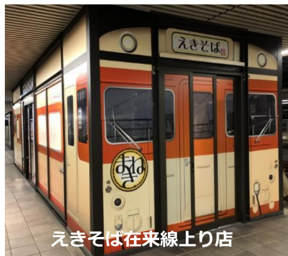
えきそば在来線上り店

とろとろの天ぷらに小エビがちらり。 かんすい入りのオリジナル中華麺使用。 まねきの看板商品です。