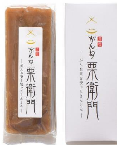
和栗のスイーツ（がんね栗の里）