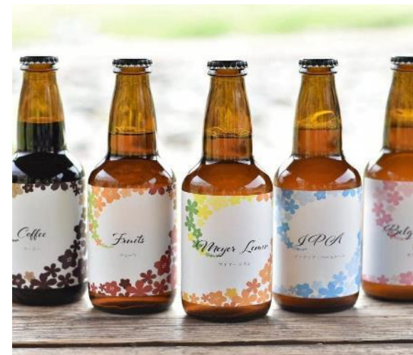
クラフトビール（マイヤーワールド）